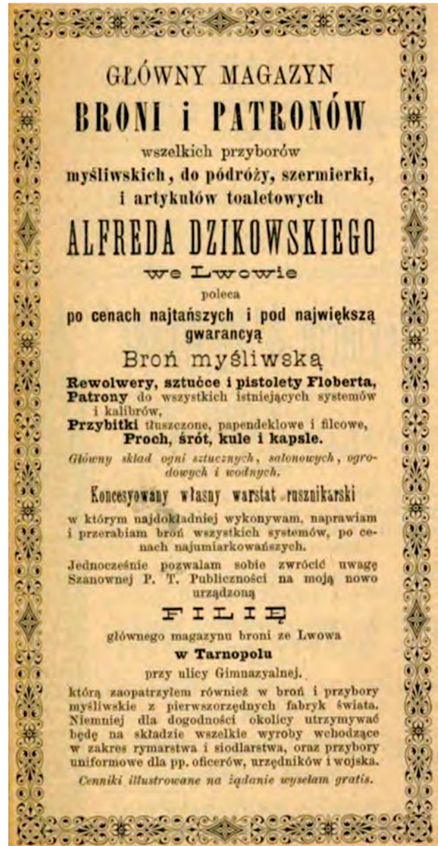
Реклама зброярської фірми Альфреда Дзіковського 8 .

Реклама зброї містилась не лише у спеціалізованих мисливських виданнях, але й у суспільних та наукових, зокрема в «Огляді» («Przegląd»), що позиціонував себе як суспільно-політичний і літературний часопис. Так, у 1888 році тут подавали рекламу мисливської зброї, але, враховуючи специфіку чита-