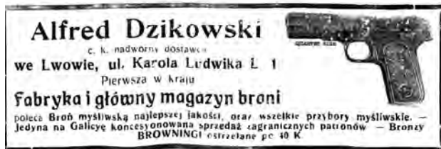
Реклама зброярської фірми Альфреда Дзіковського 24 .

У рекламі від 1908 року відзначалось, що фірма Альфреда Дзіковського була єдиною у Галичині фабрикою зброї, відзначеної на виставках найвищими нагородами, і була генеральним представником у Галичині та Буковині фабрик зброї Зауера та Коллатха 22 .