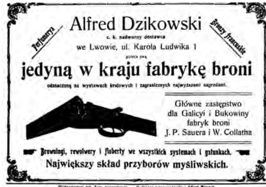
Реклама фірми (Альфреда Дзіковського) «Alfred Dzikowski».