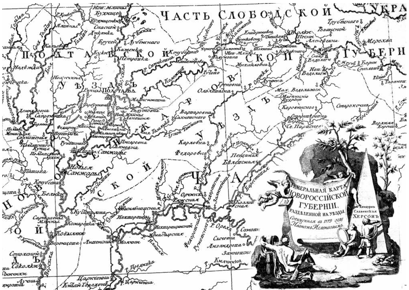
Мал. 2. Фрагмент «Генеральной карты Новороссийской губернии, разделенной на уезды», складеної І. Ісленьєвим у 1779 р.

Тож залишається останнє питання: що, насправді, було продемонстровано академіку Гільденштедту під час його перебування у Карлівці 16 вересня 1774 р.? Хіба що, може, насправді він устиг розгледіти тільки один з чотирьох бастіонів, приблизні розміри яких могли становити: фас – близько 60 м., фланк – 25 м.? Чим не маленька «крепостца»? (малюнок 2).