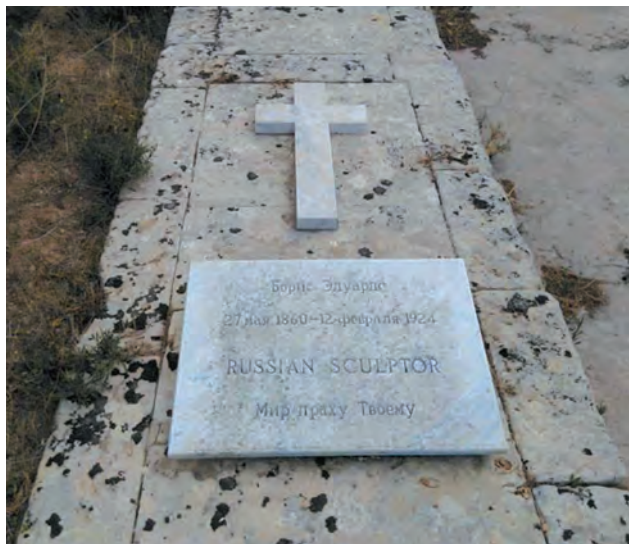
Надмогильна плита на захороненні Б.В. Едуардса на Мальті. 2016.

писаними на Мальті. Він також посвячений у перебіг пошуків могили скульптора на цьому острові. З посиланням на щоденник Едуардса, О. Маніович стверджує, що в останніх записках, які дійшли до нас (31 грудня 1923 року), Едуардс не скаржився на стан свого здоров'я.