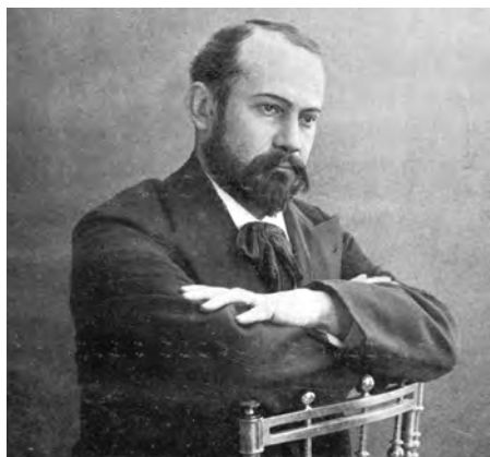
Борис Едуардс. Фото кінця 1890-х.

Ключевые слова: скульптор Борис Эдуард, Ассоциация южнорусских художников.