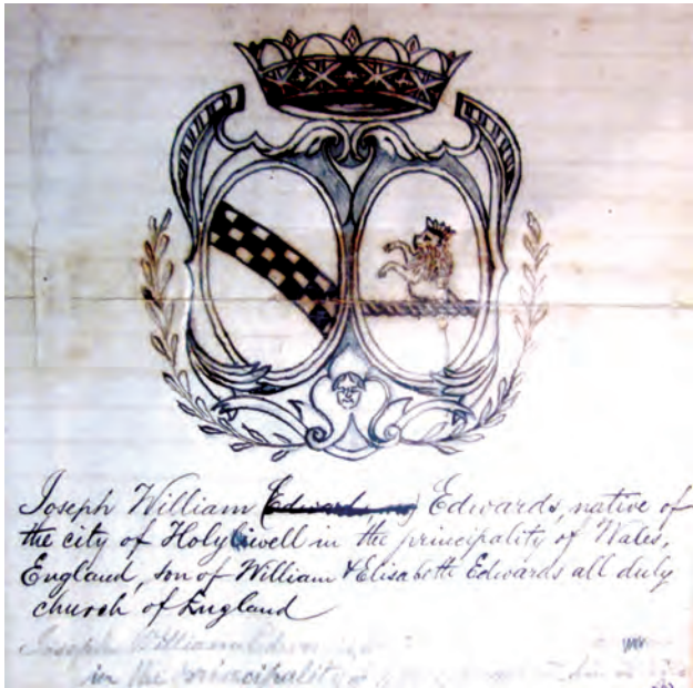
Родовий герб Едуардсів 4.