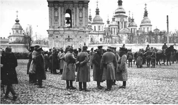
Німецькі військовики на Софійській площі у Києві. Березень 1918 р.