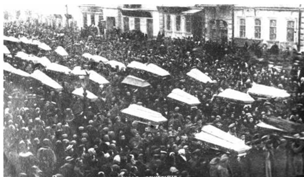
Похорон загиблих під час вуличних боїв між одеськими червоногвардійцями та українськими гайдамаками. Одеса, 18 січня 1918 р.