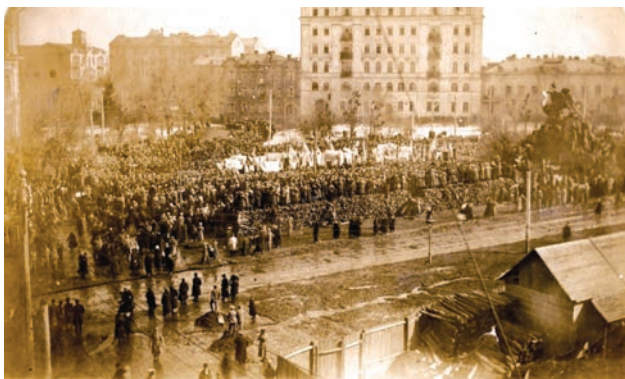
Українська маніфестація на Софійській площі у Києві. 19 березня 1917 р.

Більшість пам'яток даної теми належать до початкового етапу діяльності УЦР, коли всі зусилля українського політикуму спрямовувалися на вирішення справи самовизначення, визнання і закріплення за Центральною Радою статусу найвищого політичного органу в Україні. Серед тогочасних подій значний резонанс у суспільстві мала 100-тисячна українська маніфестація 19 березня 1917 р., яка проходила під національними гаслами. На жаль, у фондовому зібранні відсутній перший номер газети «Вісти з Української Центральної Ради», де найбільш докладно висвітлювалась ця подія. Однак про неї нагадують фотографії і поштівки, що входять до іконографічного фонду НМІУ й частково представлені в експозиції. Найбільш відомі серед них – зображення мітингу на Софійському майдані навколо пам'ятника Б.Хмельницькому 8 . В музеї зберігаються також інші знімки березневої маніфестації, на яких зафіксовано, зокрема, рух учасників акції по Бібіковському бульвару та Хрещатику 9 , а також по Олександрівській вулиці в напрямі Трьохсвятительської 10 . Про маршрут, яким рухались у той день колони маніфестантів у напрямі