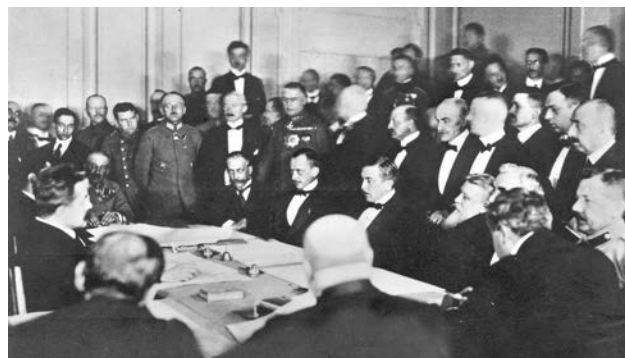
Підписання Берестейської угоди між УНР і країнами Четверного союзу. Останнє засідання в ніч з 9 на 10 лютого 1918 р. Брест, 1918 р.

Підписання Берестейського миру було великою перемогою молоді української дипломатії. Воно поклало початок міжнародно-правовому визнанню України як незалежної держави