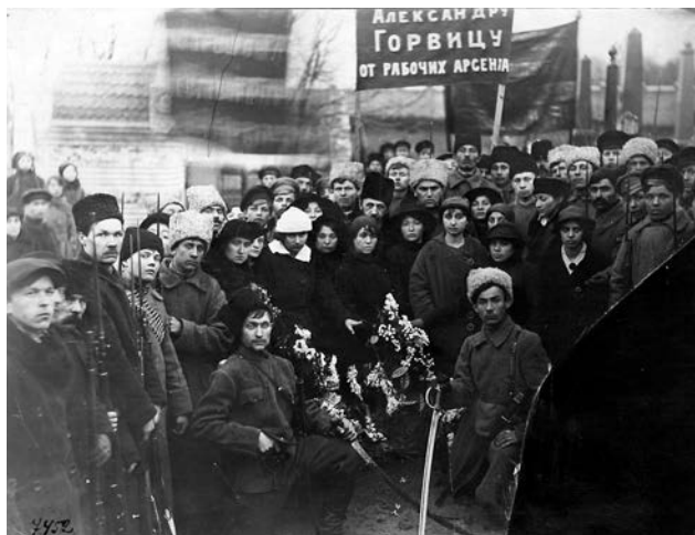
Похорон О.Горвіца, керівника Січневого повстання на заводі «Арсенал» проти Української Центральної Ради. Київ, 31 січня 1918 р.

Документальна та іконографічна збірки включають також матеріали, які висвітлюють більшовицьке Січневе повстання проти Центральної Ради в Києві 1918 р. та участь у його ліквідації Гайдамацького кошу Слобідської України на чолі з С.Петлорою і київського формування січових стрільців під проводом Є. Коновальця. Це переважно газети, листівки, фото. Серед них – листівка – «Криваві події в Києві» 31 з детально викладеною в ній хронікою повстання, оригінальні знімки із зображенням січових стрільців 32 , листівки Гайдамацького кошу із закликом боронити рідну землю від агресії більшовицької Росії 33 тощо.