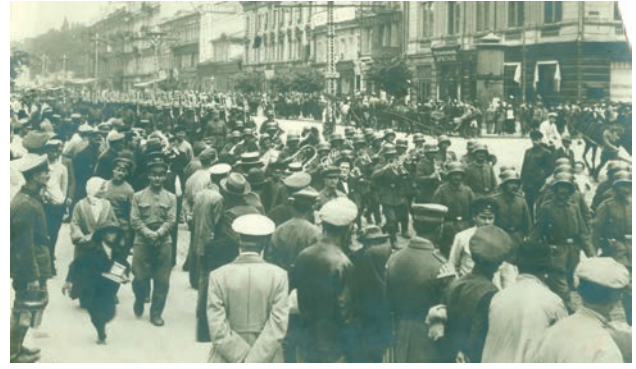
Німецькі війська марширують вулицею Хрещатик. Київ, квітень 1918 р.

імперії. Загалом, діяльність Центральної Ради за- свідчила, яким складним, болючим і суперечли- вим є процес становлення нової держави.