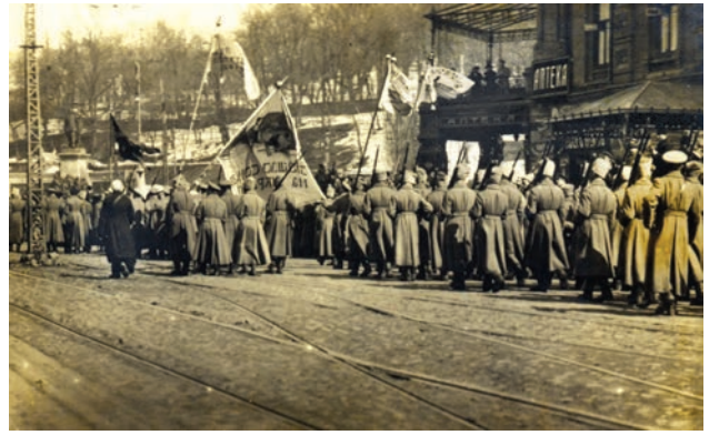
Військовики – учасники української маніфестації у Києві прямують в напрямі вул. Трьохсвятительської на Софійську площу. 19 березня 1917 р.

св. Софії, можна довідатись із тогочасних газет. Одна з них – «Последние новости» – зберігається у фондах музею. Газета цікава ще й тим, що містить репортаж про відкриття в Києві 18 березня 1917 р. по вул. Львівській (сучасна вул. Артема) першої в Україні української гімназії (приміщення жіночої гімназії А.Жекуліної). Ініціатором її створення виступило «Товариство шкільної просвіти на Україні» на чолі з І.Стешенком, майбутнім міністром народної освіти в урядах В.Винниченка та В.Голубовича. З промовами на відкритті виступили проф. М.Грушевський, І.Стешенко, директор гімназії П.Холодний, член міського виконавчого комітету С.Єфремов, представник від Галичини Л.Цегельський та інші відомі діячі. Після привітань учні гімназії виконали гімн «Ще не вмерла Україна» і пісню «Гей не дивуйте» І.Стешенка 11 .