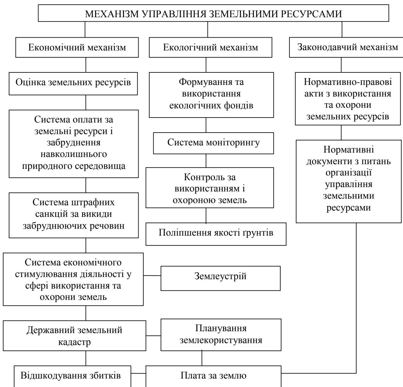
Рис. 1. Структура управління земельними ресурсами

Організація управління землекористуванням – одне з найважливіших державних завдань. Механізм такого управління можливо представити як органічне поєднання трьох властивих йому аспектів – законодавчого, економічного та екологічного забезпечення (рис. 1). Розглядаючи ці складові у взаємозв'язку між собою, особливу увагу слід спрямувати на формування ефективної системи економічних важелів – найбільш дієвого і складного методу впливу у сфері управління земельними ресурсами.