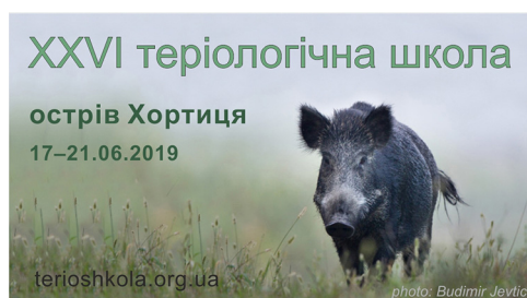
Рис. 1. Логотип та пам'ятна наклейка 26 Теріошколи (о. Хортиця, 17–21.06.2019).