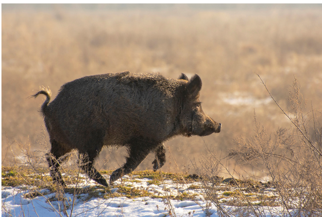
Рис. 5. Фотоконкурс «Свина та її родичі в об'єктиві»: зліва — Сергій Козодавов та учасники Школи біля фотостенду; справа — ланенячко; знизу — кабан.