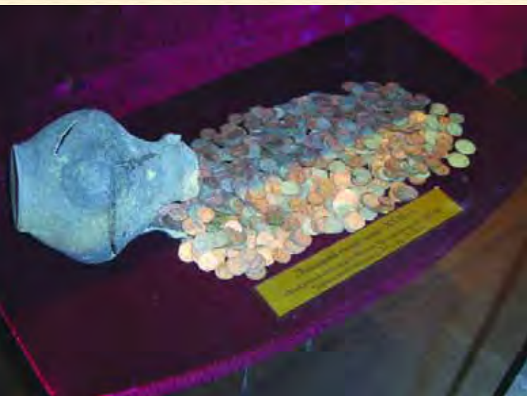
Скарб монет XVII ст., знайдений у 1970-х роках у с. Вітове Чигиринського району Черкаської області