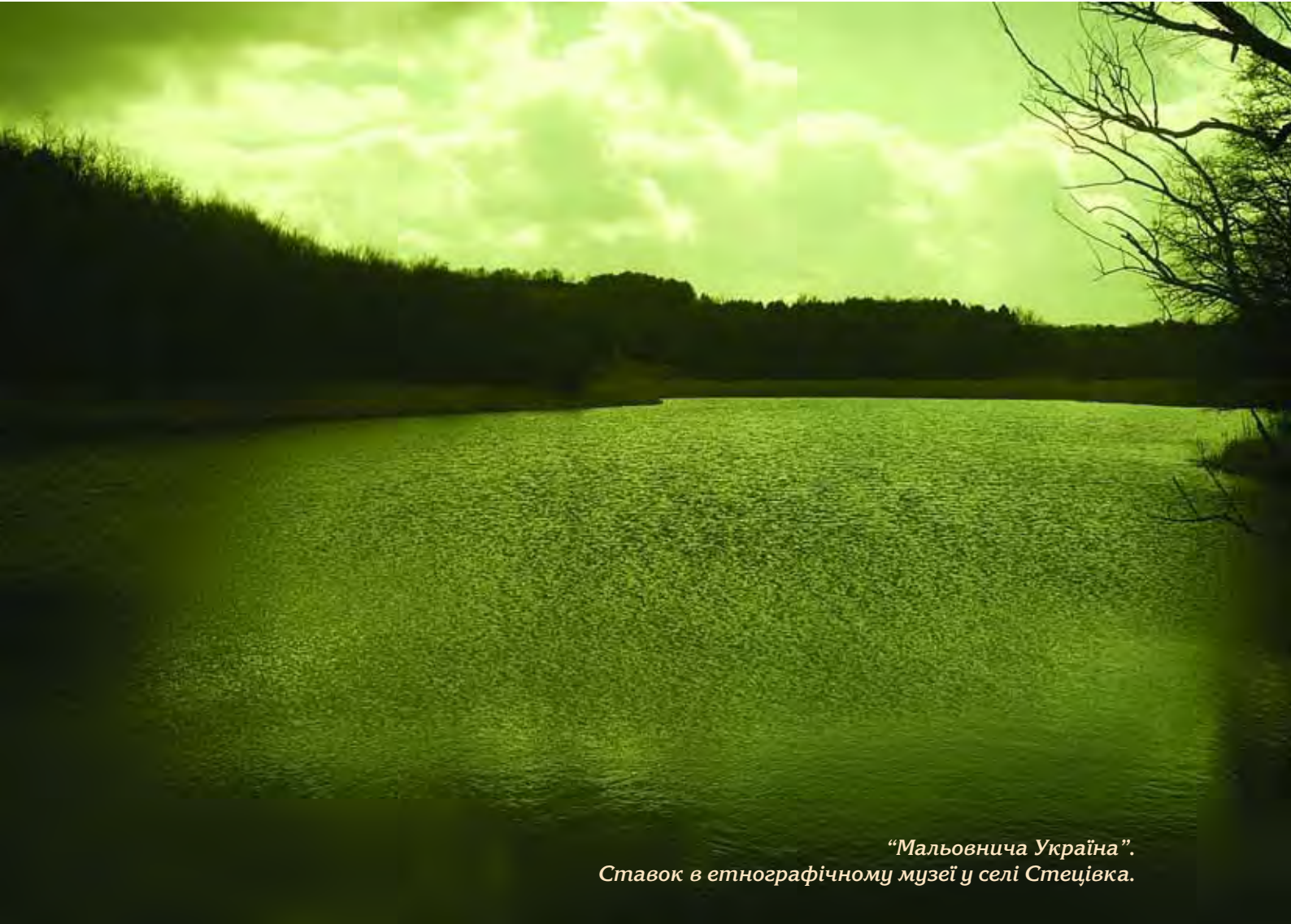
“Мальовнича Україна”. Ставок в етнографічному музеї у селі Стецівка.