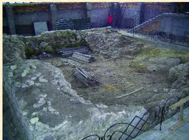
Рештки оборонної башти з укріплень садиби Хмельницьких у Суботові