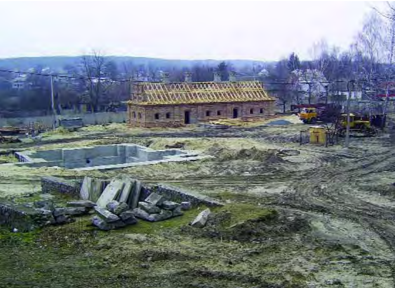
Відбудова будинків послів у Чигирині (березень 2007 року)