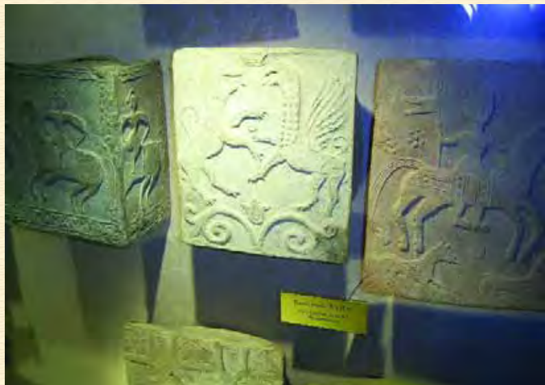
Пічні кахлі XVII ст. з археологічних розкопок на Чигиринщині