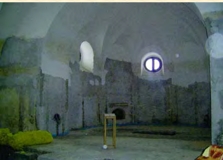
Інтер'єр Іллінської церкви у Суботові