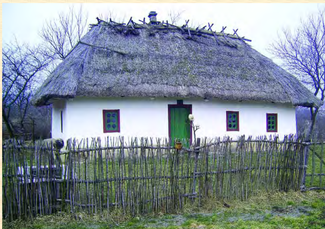
Селянська хата XIX ст. з етнографічної експозиції, створеної на місці садиби Хмельницьких у Суботові