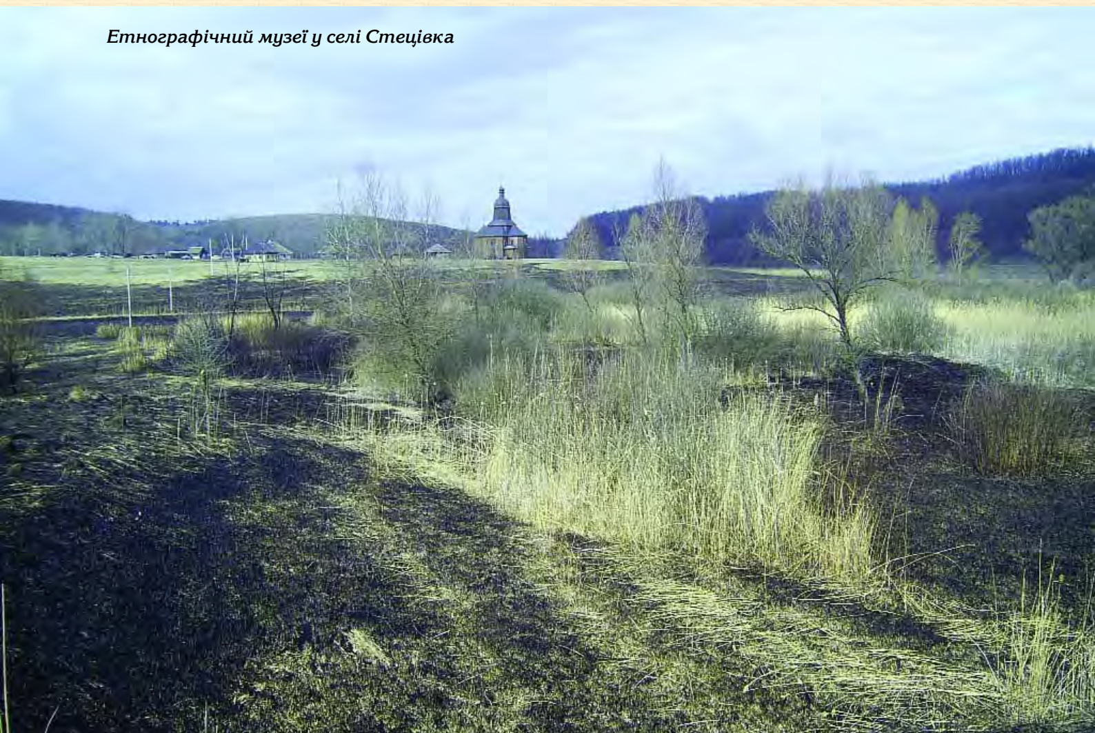
Етнографічний музеї у селі Стецівка