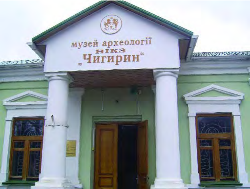
Музей археології Національного історико- культурного заповідника “Чигирин” — одна з найкращих збірок археологічних знахідок козацького краю