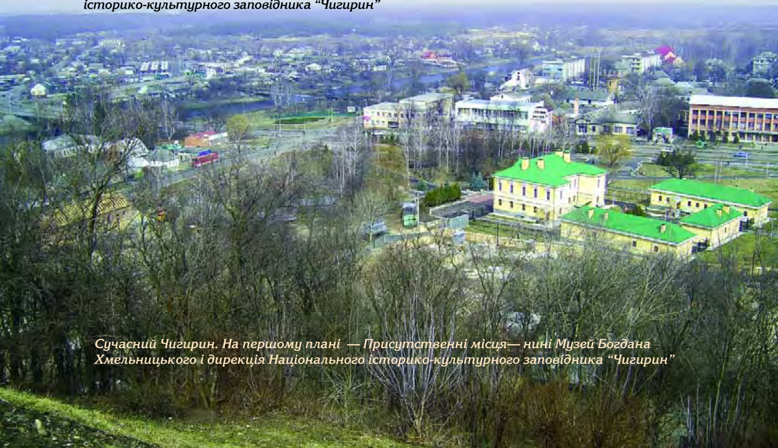
Сучасний Чигирин. На першому плані — Присутственні місця— нині Музей Богдана Хмельницького і дирекція Національного історико-культурного заповідника “Чигирин”