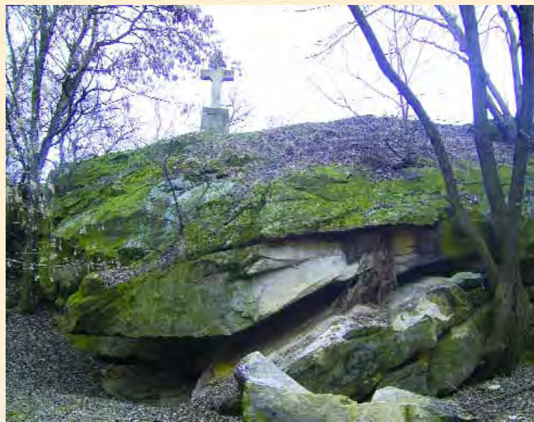
Пам'ятник захисникам Чигирини 1677–78 рр.