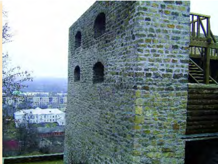
Бастіон Дорошенка на Богдановій горі у Чигирині