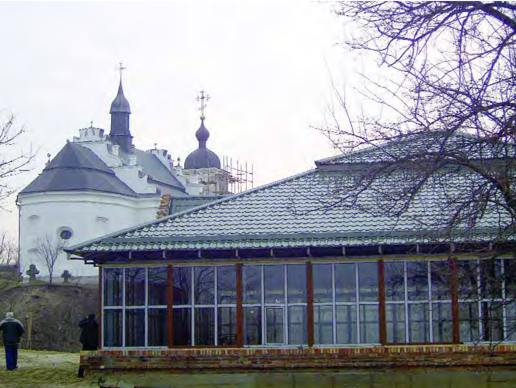
Павільйон над залишками оборонної споруди садиби Хмельницьких у Суботові