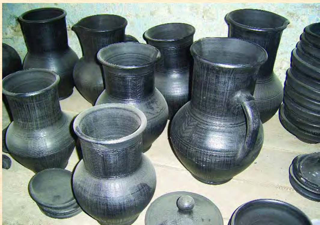
Гончарні вироби народних майстрів — учасників фестивалю гончарів на Чигиринщині