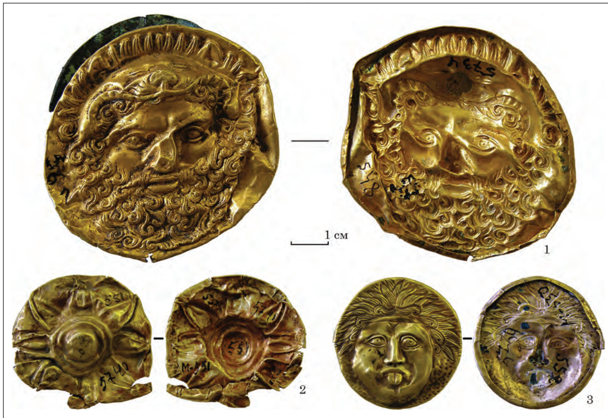
Рис. 1. Бляхи-прикраси кінської вузди з Чмиревої Могили. Харківський історичний музей імені М. Ф. Сумцова, ЛВЗ-17, ЛВЗ-3, ЛВЗ-4

була тимчасово залишена в Ермітажі для виготовлення гальванокопій, але згодом так і лишилася у колекції музею. При цьому бронзові навершя з колекції 1898 року також були розділені. У Ермітажі залишилися навершя кращої збереженості та технологічної довершеності (Дн 1898 1/328). Інші три навершя повернулися до України.