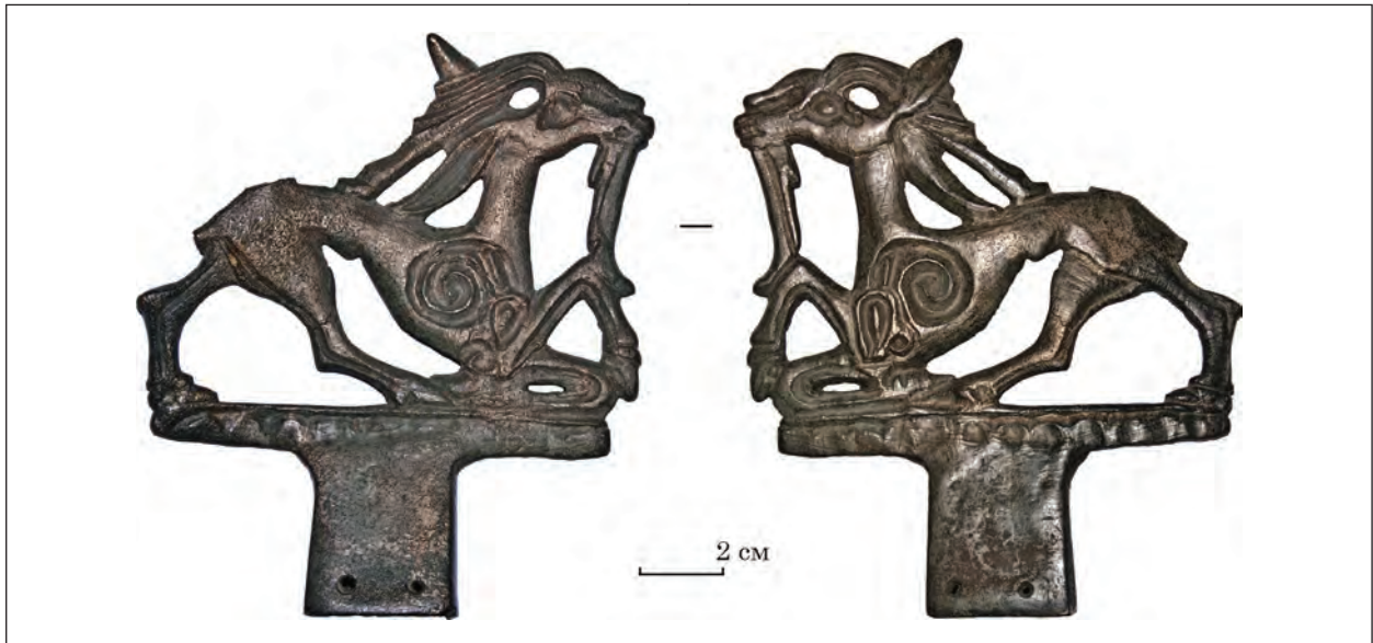
Рис. 7. Навершя з Чмиревої Могили (ЧМ-4). Харківський історичний музей імені М. Ф. Сумцова, Арх 149/113

Розміри уламка фігурки оленя — 9,4 × 6 см. Розміри втулки з підніжкою у максимальних значеннях — висота 6 см, ширина 5,9 см 1 .