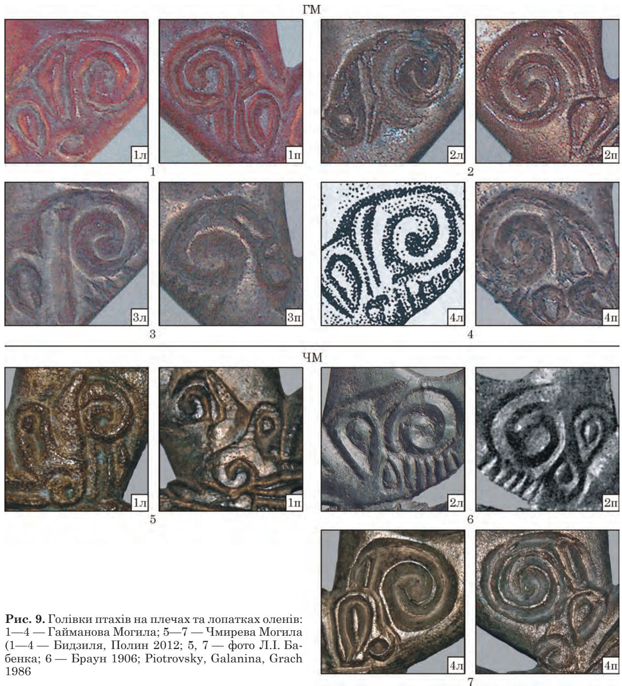
Рис. 9. Голівки птахів на плечах та лопатках оленів: 1—4 — Гайманова Могила; 5—7 — Чмирева Могила (1—4 — Бидзиля, Полин 2012; 5, 7 — фото Л.І. Бабенка; 6 — Браун 1906; Piotrovsky, Galanina, Grach 1986

тонкою рельєфною смугою на початку спірального поглиблення. Дзьоб трактовано спіраллю, далекою від природного прототипу. Додаткова голівка птаха фактично відсутня. Від образотворчої схеми «зооморфних перетворень» залишився лише завиток під очницею, що можна трактувати як рудимент дзьоба птаха 2, інші елементи якого відсутні. Цікаво, що на ЧМ-4л спіралі дзьоба і завитка закручені в одну сторону, на ЧМ-4п — у різні.