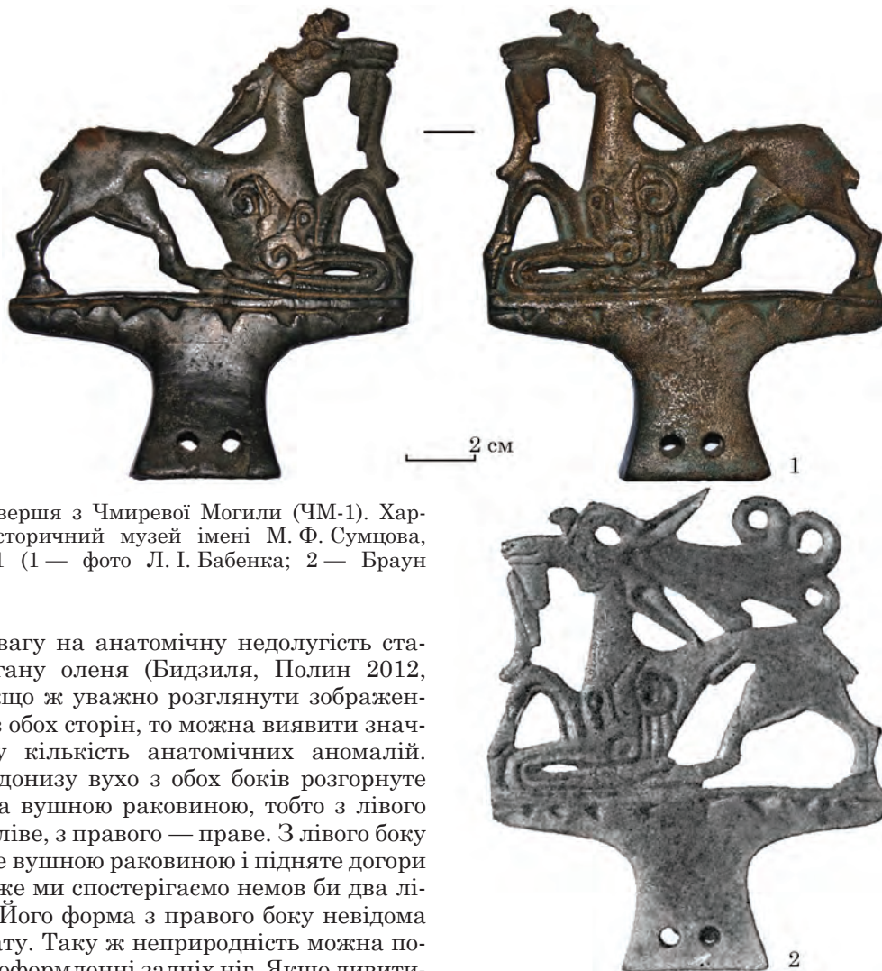
Рис. 3. Навершя з Чмиревої Могили (ЧМ-1). Харківський історичний музей імені М. Ф. Сумцова, Арх 149/111 (1 — фото Л. І. Бабенка; 2 — Браун 1906)

звернув увагу на анатомічну недолугість статевого органу оленя (Бидзиля, Полин 2012, с. 260). Якщо ж уважно розглянути зображення оленя з обох сторін, то можна виявити значно більшу кількість анатомічних аномалій. Опущене донизу вухо з обох боків розгорнуте до глядача вушною раковиною, тобто з лівого боку воно ліве, з правого — праве. З лівого боку розгорнуте вушною раковиною і підняте догори вухо — отже ми спостерігаємо немов би два лівих вуха. Його форма з правого боку невідома через втрату. Таку ж неприродність можна побачити і в оформленні задніх ніг. Якщо дивитися на оленя зліва, то ліва нога буде відставлена назад, а права — висунута вперед. З правого боку розміщення ніг протилежне — відставлена назад права нога, просунута вперед — ліва. Скоріш за все, так само недолуго оформлені і передні ноги, хоча через схематизм їх зображення не можна стверджувати це напевно. Разом з цим для навершя характерна висока чіткість рельєфу ряду елементів — задніх ніг, яким притаманна, можливо, найбільш висока природність, борода тощо. Серед інших це навершя вирізняє і зовнішній вигляд рельєфного знаку на плечі та лопатці, що найближчий до природного прототипу (докладніший аналіз знаків див. нижче).