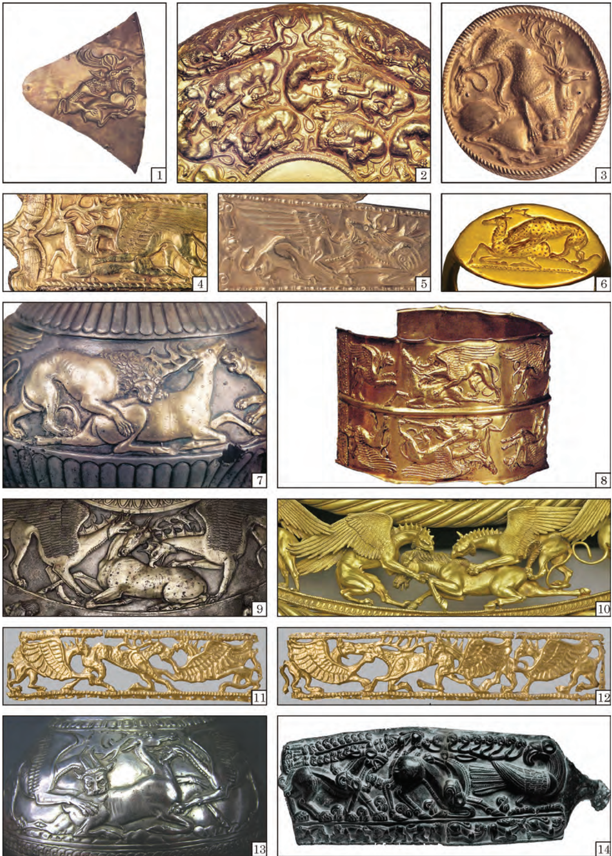
Рис. 8. Сюжети із зображенням сцен нападу та шматування: 1 — IV Семибратній курган; 2 — Солоха; 3 — Братоловівський курган; 4, 10 — Товста Могила; 5 — Велика Білозерка; 6 — VI Семибратній курган; 7, 8 — Куль-Оба; 9 — Чортмлик; 11—12 — Олександропіль; 13 — Великий Рижанівський курган; 14 — Гирчиново (1, 2, 4, 7, 8 — Piotrovsky, Galanina, Grach 1986; 3, 5 — Толочко (ред.) 1991; 6 — Перстень... 1998—2018; 9 — Алексеев 2012; 10 — Dally 2007; 11, 12 — Полин, Алексеев 2018; 13 — Трейстер 2018; 14 — Венедиков, Герасимов 1973)