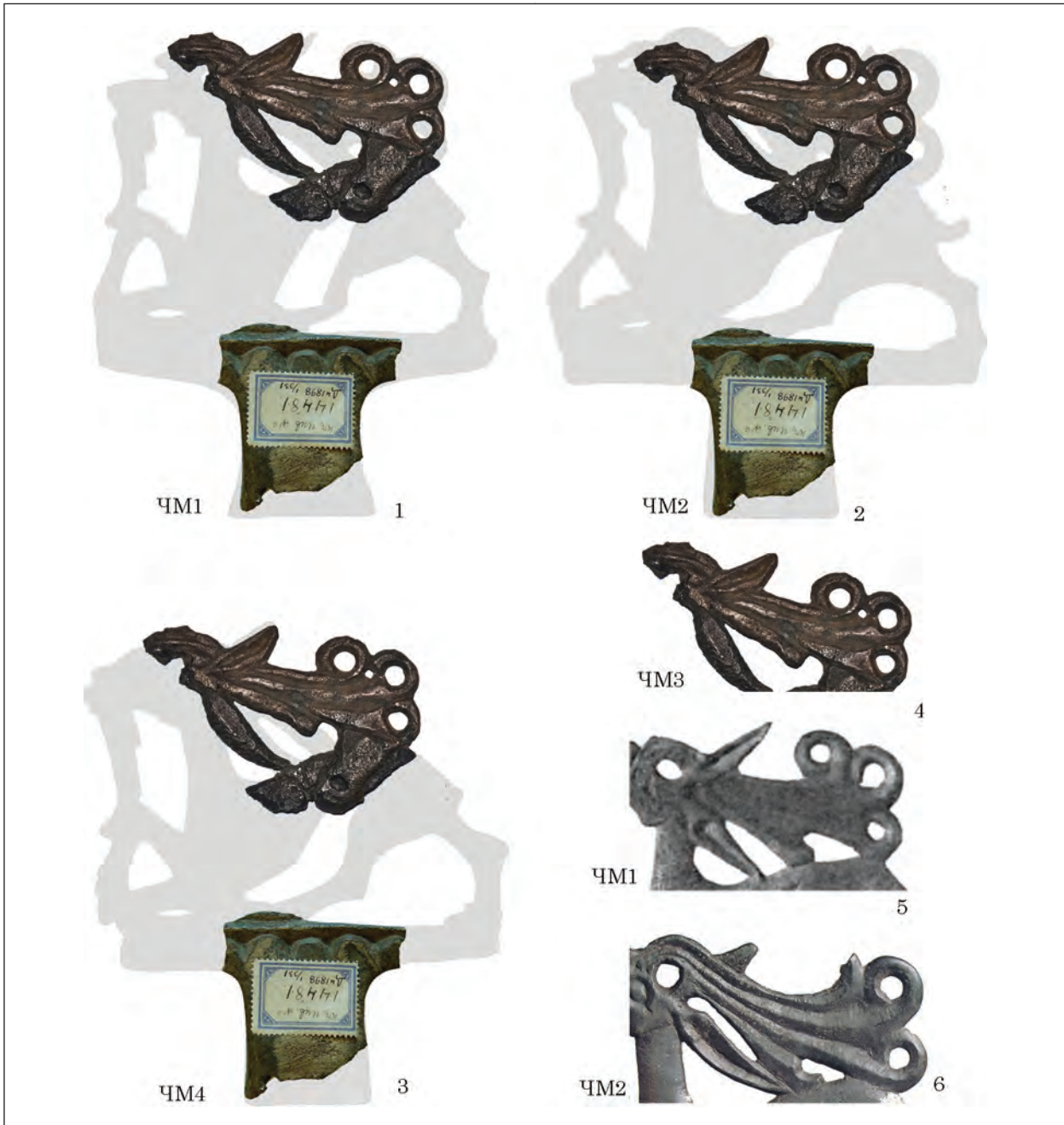
Рис. 6. Суміщення деталей: 1—3 — суміщення фрагментів наверхів ЧМ-3 з силуетами наверхів чмирівської серії; 4—6 — зіставлення гілок рогів наверхів чмирівської серії

з ливарним браком при початковому литті через недолив металу у форму, а саме з ремонтом пошкоджень, отриманих наверхням внаслідок його використання.