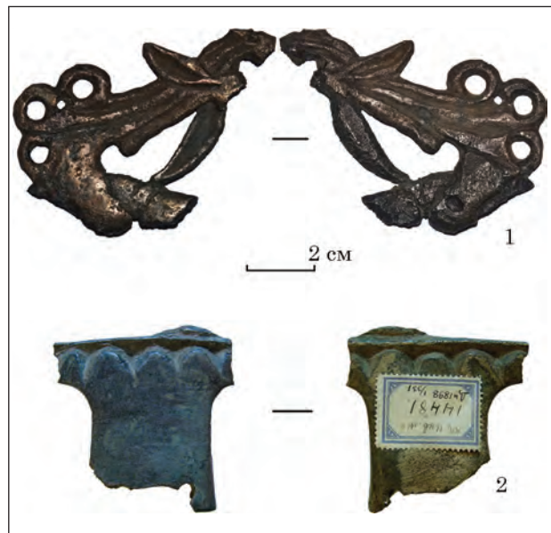
Рис. 5. Навершя з Чмиревої Могили (ЧМ-3): 1 — Харківський історичний музей імені М. Ф. Сумцова, Арх 96/32; 2 — Державний Ермітаж, Дн 1898 1/331

Від фігурки оленя збереглася лише задня частина тулуба, задні гілки рогів та два вуха. Добре помітно, що фігурка відливалася у два прийоми — до відлитих спочатку тулуба та нижнього вуха були приєднані гілки рогів та верхнє вуха. Якість першого і другого лиття дуже відрізняється. За довершеністю нижнє вуха не поступається іншим навершям. Частина тулуба першої відливки у порівнянні з тулубом оленів інших навершів більш витончена, «субтильна» — це добре помітно при суміщенні цього фрагмента з силуетами фігурок інших на-