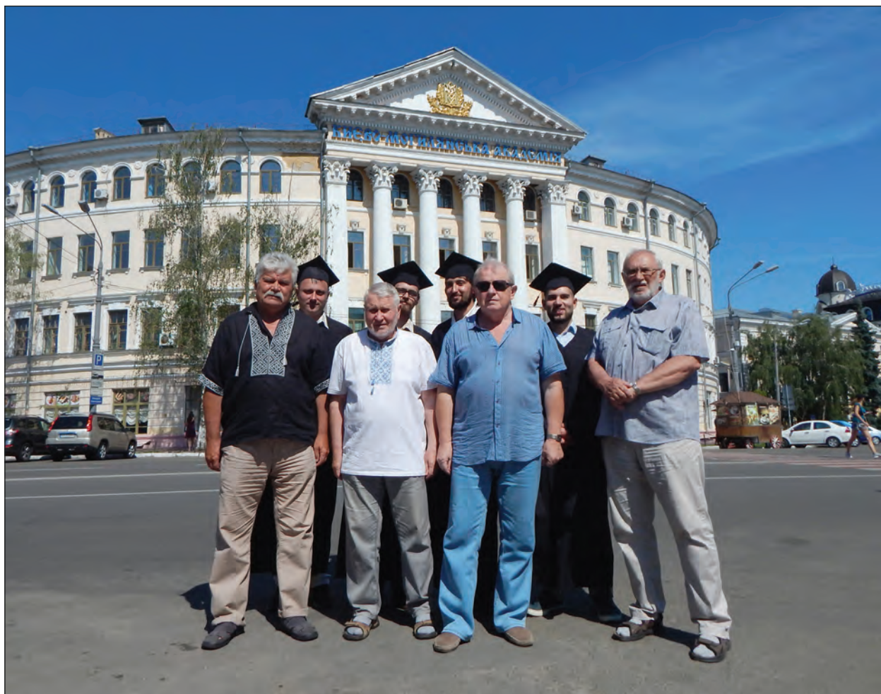
Випуск магістрів-археологів НАУКМа 2017