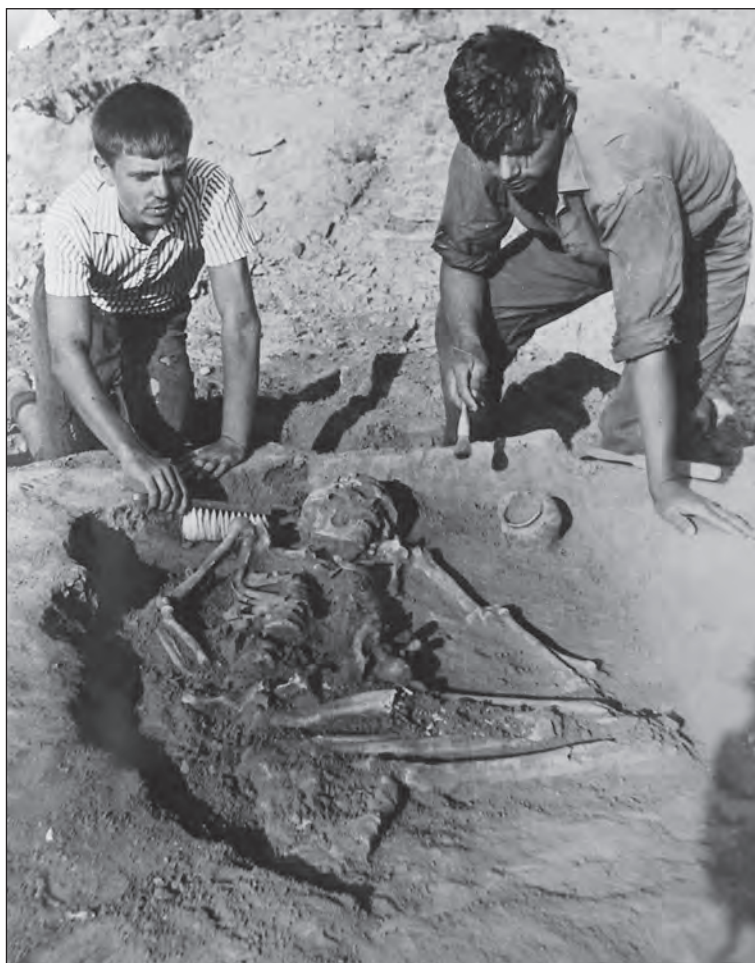
Каховська експедиція. Курган біля Любимівки 1968 р.