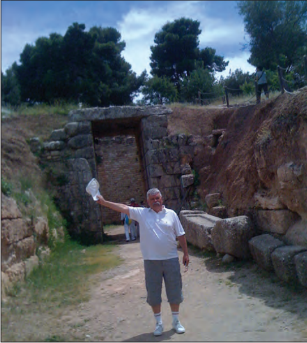
В Мікенах біля гробниці Лева, 2016 р.