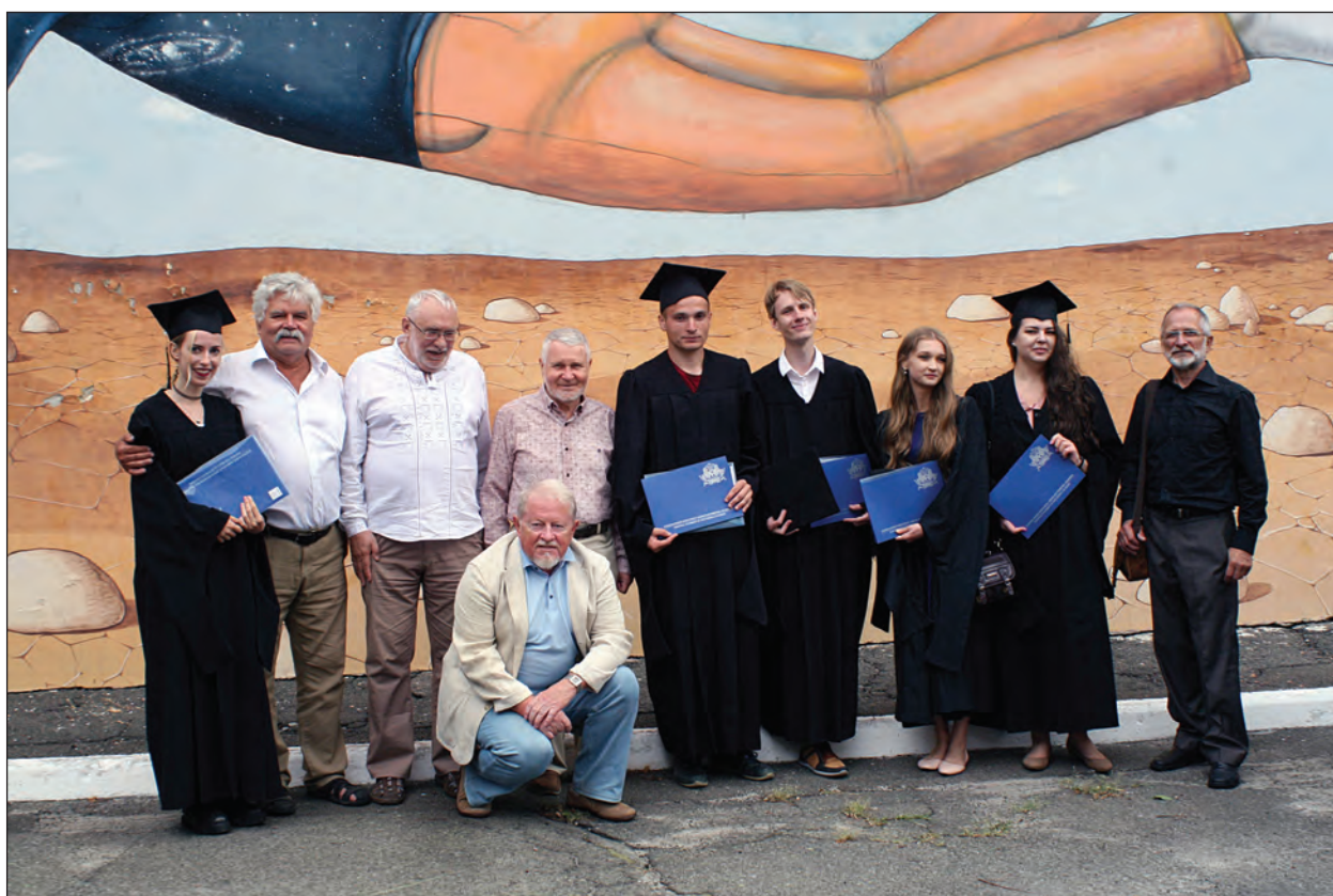
Випуск магістрів-археологів НаУКМА, 2019 р.