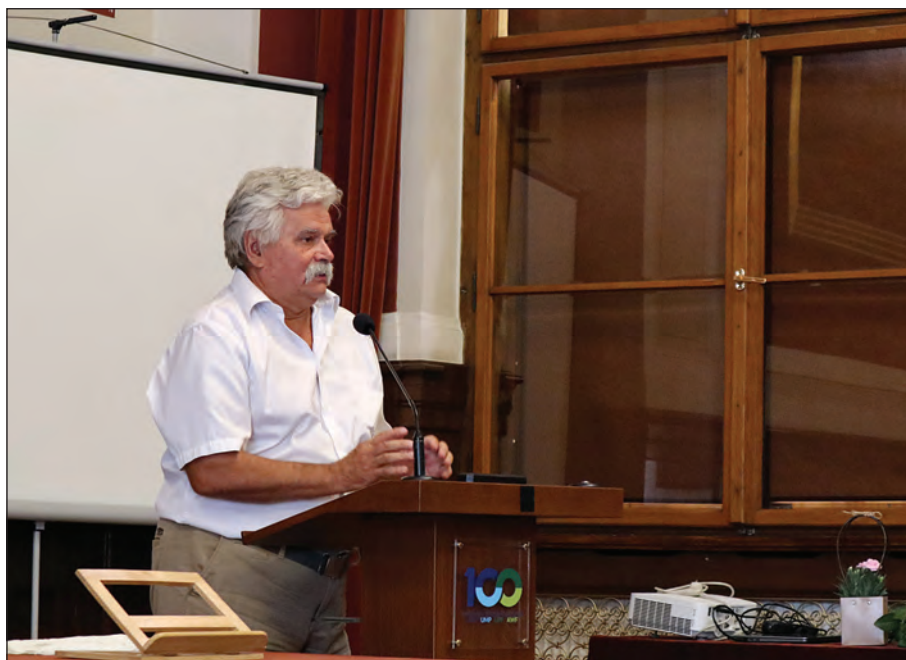
Виступ з привітальним словом від української делегації на урочистостях з нагоди ювілею професора Олександра Косько у Великій залі Познанського університету ім. А. Міцкевича, 2019 р.