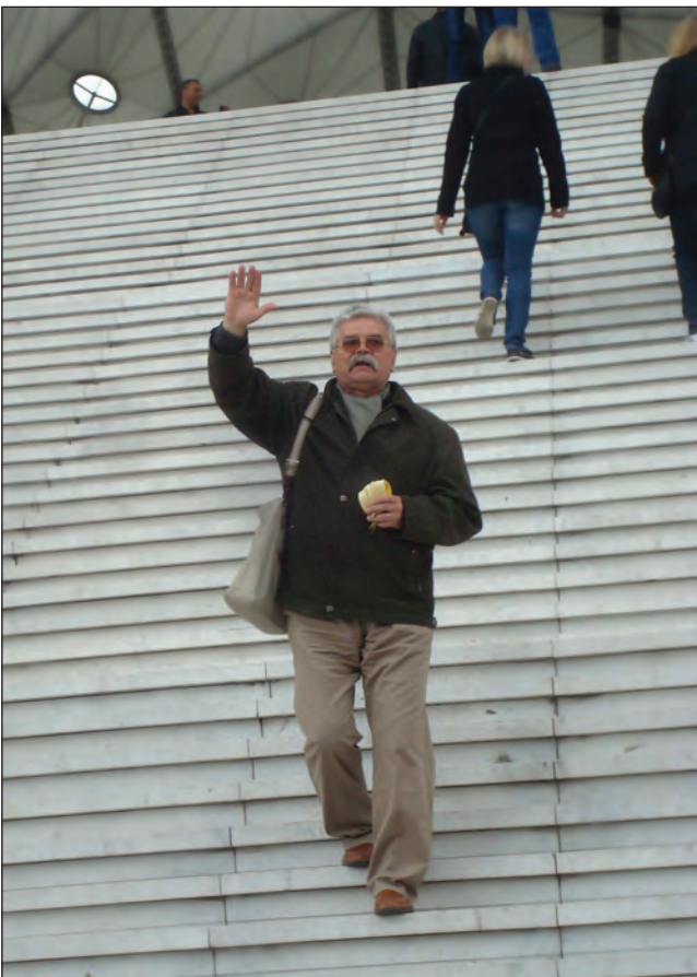
Париж. 2012. На сходах Триумфальної арки в кварталі Дефанс