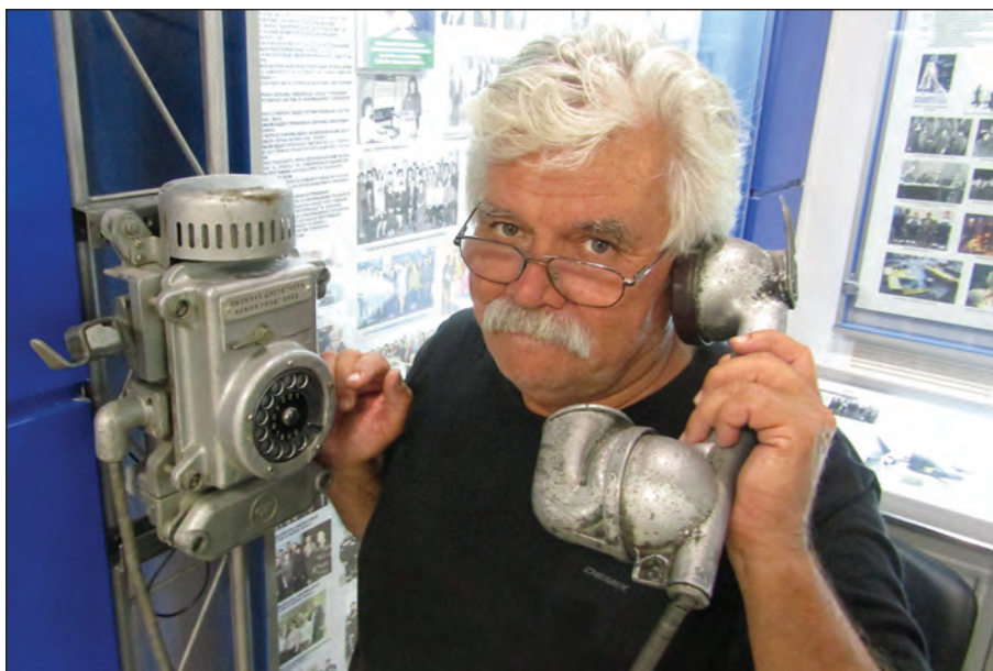
В музеї Горішніх Плавнів, 2019 р.