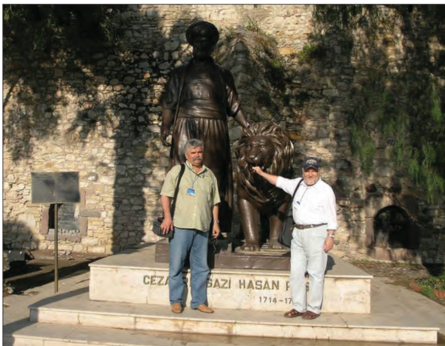
Чешме (Туреччина) біля пам'ятнику командувача флотом Османської імперії (капудан-паши) Хасан-бею в Чесменській битві, 2007 р.