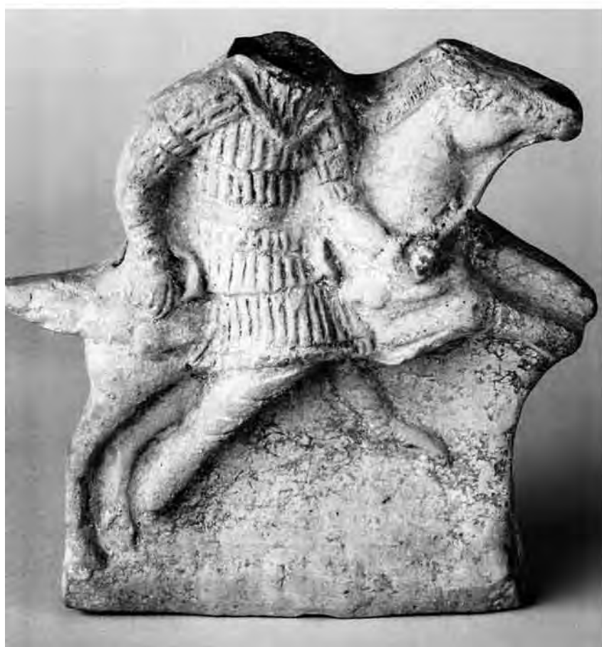
Рис. 2. Зображення сарматських панцирів. 1 – колона Траяна (Watson, 1983); 2 – теракота з Керчі.