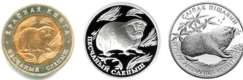
Рис. 7. Українська «сліпак» монета (2005) та її російські «попередники» 1994 та 1996 років.

Fig. 6. Comparison of Ukrainian "bison" coins with analogues, as "predecessors" as "followers". Top row: Russian 1994 and 1997, Ukrainian 2003; bottom row: Belarusian 2012 silver with a face value of "20 rubles", Belarusian 2012 gold with diamonds with a face value of "20 rubles", Polish 2013 with a face value of "2 zloty".