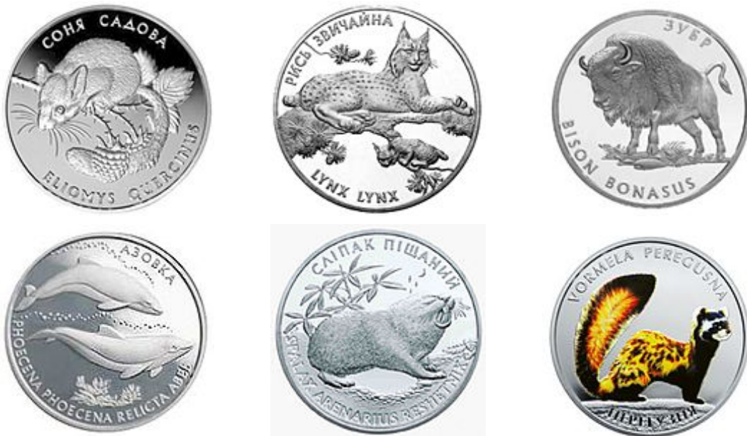
Рис. 1. Реверси монет з серії «Флора і фауна» (за зображеннями з колекції Вікімедія).

Поза цією серією з позначенням «Інші монети» у грудні 2012 р. викарбувано монету з нагоди Міжнародного Року кажана (Про введення..., 2013). Поява цієї монети сталася завдяки низці ініціатив теріологів України та відповідних просвітницьких акцій. Монету було презентовано товариству на XX Теріологічній школі (Карпатський НПП, 2013 р.).