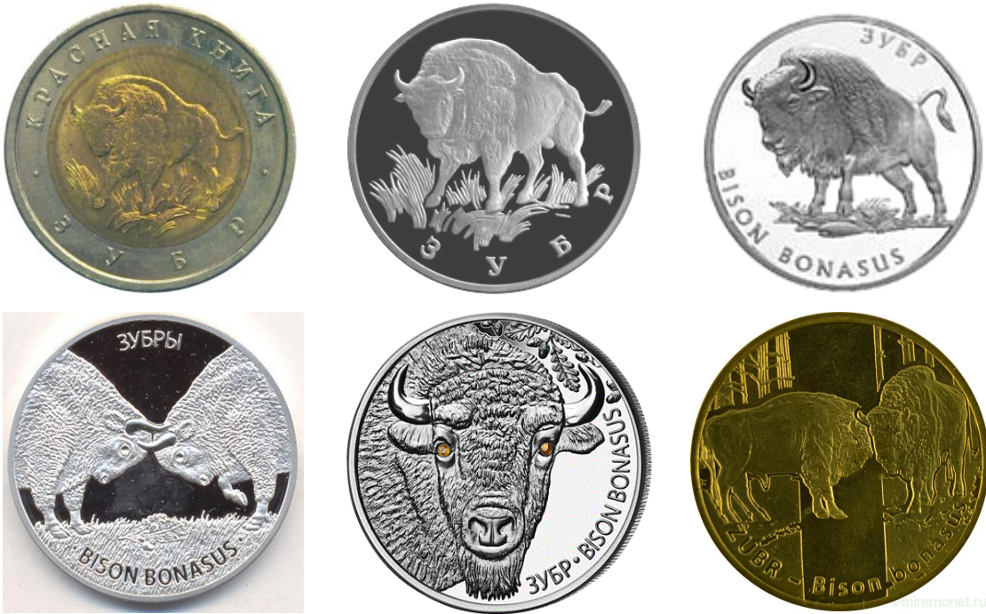
Рис. 6. Порівняння українських «зубрових» монет з аналогами-«попередниками» та «послідовниками»: верхній ряд — російська 1994 р. та 1997 р., українська 2003 р.; нижній ряд — білоруська 2012 р. зі срібла номіналом «20 руб.», білоруська 2012 р. золота з діамантами номіналом «20 руб.», польська 2013 р. «2 злотих».

Fig. 6. Comparison of Ukrainian "bison" coins with analogues, as "predecessors" as "followers". Top row: Russian 1994 and 1997, Ukrainian 2003; bottom row: Belarusian 2012 silver with a face value of "20 rubles", Belarusian 2012 gold with diamonds with a face value of "20 rubles", Polish 2013 with a face value of "2 zloty".