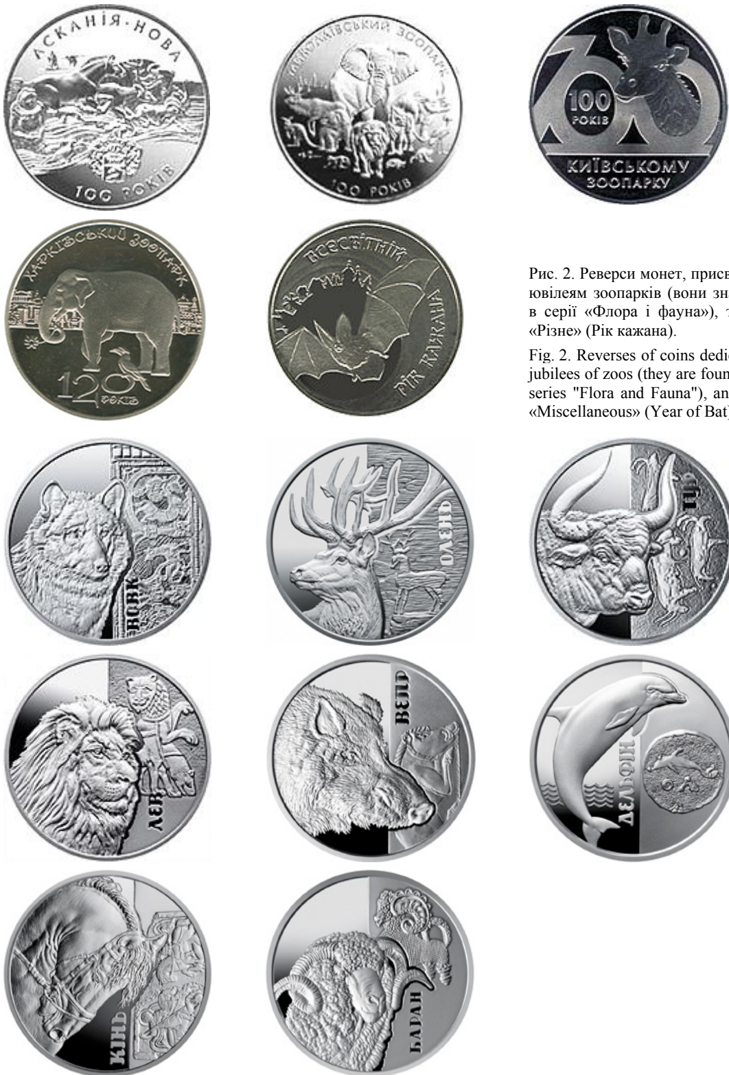
Рис. 2. Реверси монет, присвячених ювілеям зоопарків (вони значаться в серії «Флора і фауна»), та серії «Різне» (Рік кажана).