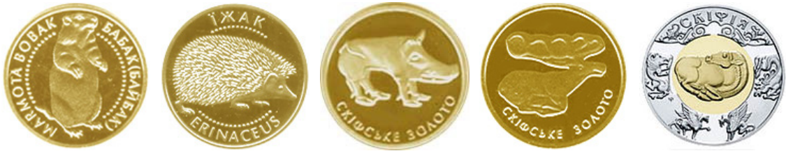
Рис. 4. Реверси «теріологічних» монет з серії «Найменша золота монета» та однієї «теріологічної» монети монет із серії «Пам'ятки давніх культур України» (скіфський олень).

Fig. 4. Reverses of “theriological” coins from the series “The Smallest Gold Coin” and one of “theriological” coin from the series «Monuments of Ancient Cultures of Ukraine» (Scythian deer).