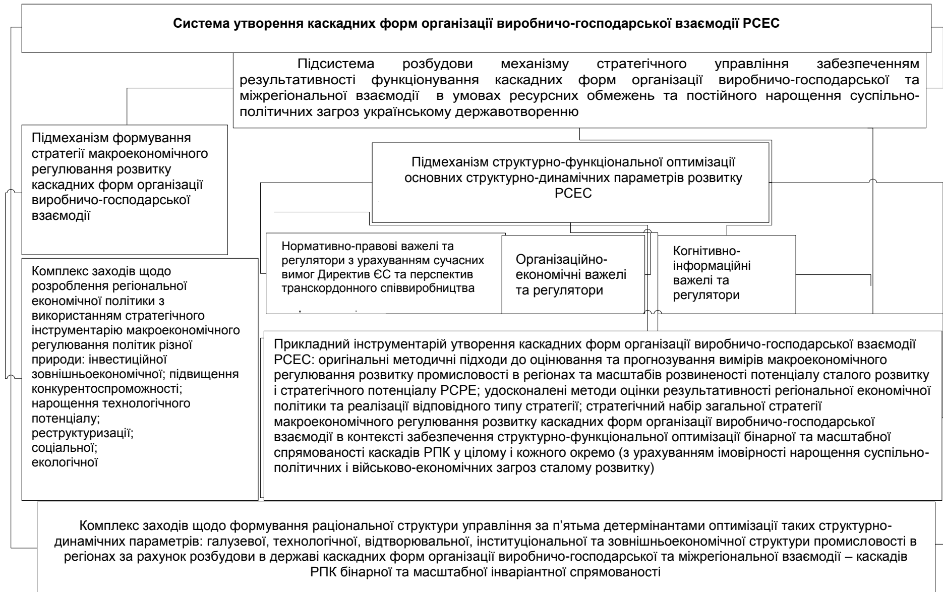
Рис. 2. Методологічна схема системи утворення каскадних форм організації виробничо-господарської взаємодії РСЕС та адаптації в її межах відповідного типу механізму