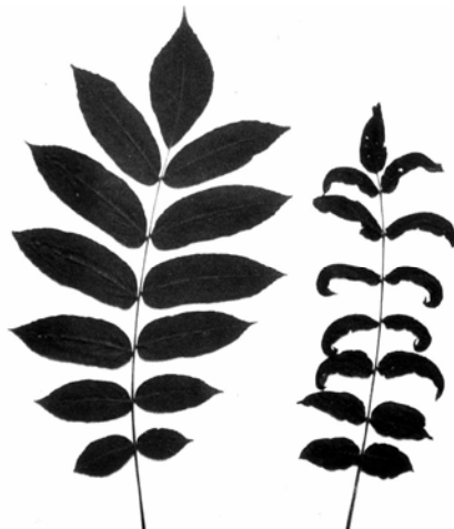
Рис. 2 – Дефектный лист апомикта маньчжурского ореха (справа). Слева – лист его материнской формы.

Объяснить это явление возможно лишь тем, что при псевдогамии или близком к нему типу апомиксиса возникает полиплоидизация ядра яйцеклетки, показанная Г. В. Канделаки и Е. Г. Гваладзе [19], цитологически исследовавшими результаты скрещиваний в роде Triticum . Следует однако высказать предположение, что полиплоидизация хромосомного набора ядра происходит не только на начальных стадиях развития яйцеклетки, но и в процессе роста гаплоидного растения, на что указывают исследования "ложных" ржано-пшеничных гибридов А. Т. Трухановой [31], Б. Ф. Юдина с Л. А. Лукиной [39] у кукурузы и Ю. Н. Исакова с соавторами [18] у сосны обыкновенной. В этом случае возникают химеры различной степени пloidности.