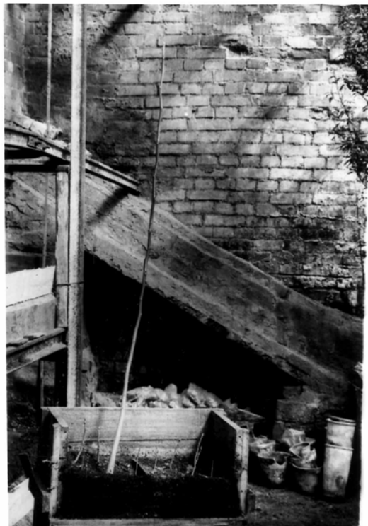
Рис. 3 – Гигантский апомикт грецкого ореха, достигший в первый год 154 см высоты. Рядом селекционный брак и отставшие в росте сеянцы, полученные одновременно от одной и той же матери.

Как говорилось выше, при наличии в геноме генетического груза в апомиктическом потомстве возникает большое количество уродливых форм, которые не отмечались у матери. Выбраковка таких растений дает возможность отселектировать генетически улучшенный посадматериал, на что нами были получены два патента [7, 8] по таким показателям, как зимостойкость, быстрота роста, высокое содержание ядра в орехе. Так, в условиях Степи высота однолетних сеянцев грецкого ореха от свободного опыления в неполивных условиях находится в пределах 15 – 25 см; апомикты нередко достигали 60 – 90 см высоты, а в одном случае высота однолетнего сеянца достигла 154 см (рис. 3). У дерева КС-10-32 среднее содержание ядра в орехах составляет 37,87 %, а у его апомиктических потомков эти показатели находились в пределах 38,40 – 60,51 %. У дерева КС-15-6 они составляли 39,04 и 42,0 – 51,82 % соответственно.