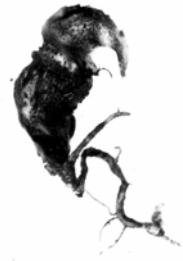
Рис. 1 – Нежизнеспособные апомикты грецкого ореха, полученные от плюсовых материнских форм, отягощенных генетическим грузом