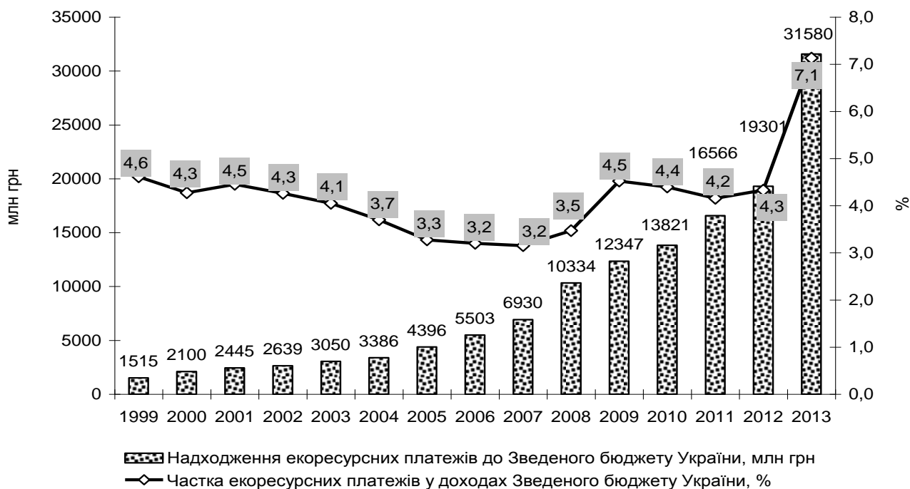
Рис. 1. Надходження екоресурсних платежів та їх частка в доходах Зведеного бюджету України за 1999–2013 роки (розраховано за даними оперативного обліку Державної фіскальної служби України та Державної служби статистики України)

За період з 1999 по 2013 рік у динаміці надходжень екоресурсних платежів до Зведеного бюджету України спостерігалася висхідна тенденція, котра, як правило, була зумовлена механічним збільшенням нормативів плати за спеціальне використання природних ресурсів та забруднення навколишнього природного середовища внаслідок їх індексації у зв'язку з інфляційними процесами [11]. Найбільш інтенсивно величина екоресурсних платежів до Зведеного бюджету України зросла у 2013 році порівняно з 2012 у зв'язку із суттєвим збільшенням надходжень плати за користування надрами (рис. 1).