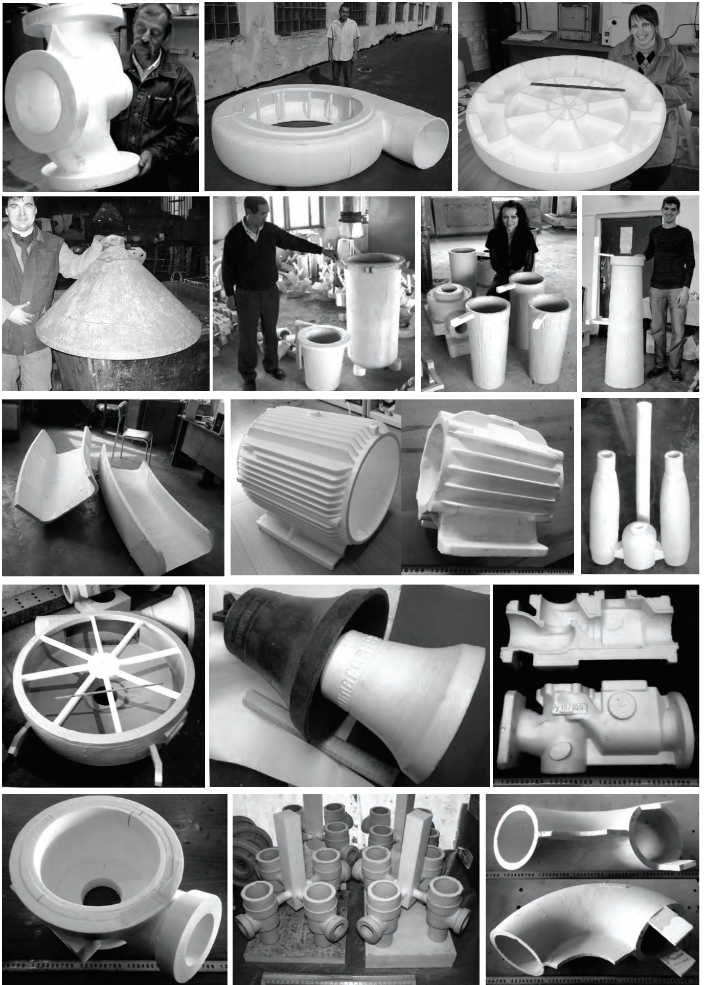
Рис. 1. Примеры моделей отливок оболочковых конструкций