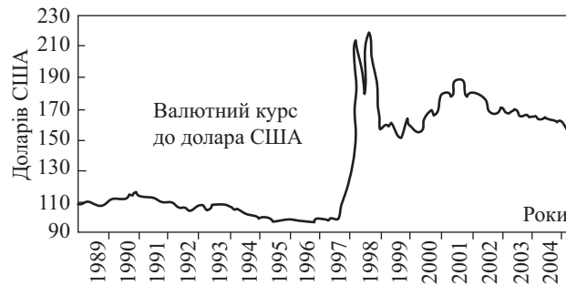
«Раптова зупинка» потоків у Південно-Східній Азії у 1997 р.

реального валютного курсу. Іншими словами, момент «раптової зупинки» настає в умовах кризи поточного рахунку, що пояснюється фінансуванням дефіциту рахунку поточних операцій саме припливом капіталу [19, с. 48].