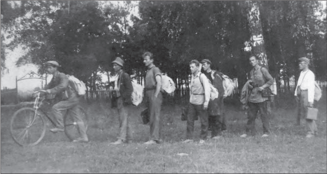
Рис. 1. Польова група в дорозі (Звіт... 1932, арк. 13)

Взагалі мене цікавила історія промисловості Правобережного Полісся, як певного історично-економічного району, на ґрунті вивчення історії поодиноких промислових галузей. Так з'явилася в мене думка перевести комплексне дослідження проблеми Правобережного Полісся в його історично-промисловому розвитку. <...> час для польових дослідів Поліської експедиції ВУАН і Всеукраїнського Історичного Музею в Києві, яку я організував 1932 року і якою керував, був надто обмежений і, будь-що-будь, мало сприятливий, а умовини праці були досить важкі, навіть небезпечні» (Оглоблін 1995, с. 13—14).