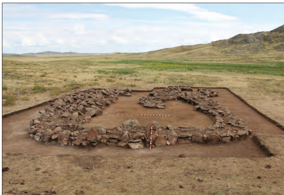
Рис. 3. Жилище на поселении Тагыбайбулак (фото)

ды 2, к. 5 (рис. 2: 5, 6), близки бронзовые ножи из Кособы и Едирей 3 (рис. 2: 11, 12), пробойники из Карашоки и Акбеит (рис. 2: 13, 14).