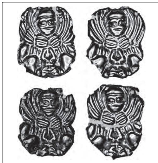
Рис. 7. Золоті аплікації із зображенням сфінкса з симетрично розгорнутим тулубом з кургану поблизу Красний Поділ, Херсонська обл.

Ще два типи стилізації образу сфінкса на золотих пластинках, зафіксовані серед апліка-