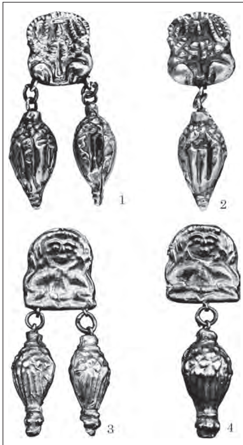
Рис. 8. Зображення сфінксів із подвійним тулубом на елементах нашійних прикрас: 1 — золоті коробчасті ланки ланцюжка з кургану поблизу радгоспу «Степовий», Запорізька обл.; 2 — деталі ланцюжка з кургану 3 (пох. 2) поблизу с. Ізобільне, Дніпропетровська обл.

підвішували за допомогою мініатюрного кільця, прикріпленого до петель — вони напаяні по одній і по дві знизу на коробчастій ланці (Клочко 2014, с. 117, рис. 4: 1, 2).