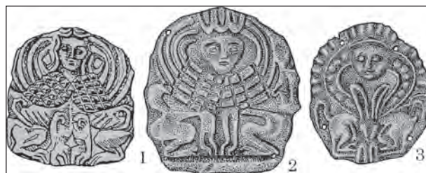
Рис. 5. Прикраси головних уборів: золоті пластинки із зображенням сфінкса з подвійним тулубом: 1 — великий курган М. Веселовського поблизу с. Мала Лепетиха, Херсонська обл.; 2—3 — курган 8 поблизу с. Вовчанське, Херсонська обл.

А. П. Манцевич зазначала, що мотив «сфінкс з подвійним тулубом» був значно поширений в античному світі (Манцевич 1987, с. 31). Дослідниця підкреслила, що майстри застосовували різні засоби стилізації при створенні образу: 1) тулуб повністю подвоєний, тому груди і лапи істоти подані в профіль, 2) подвоєння тільки