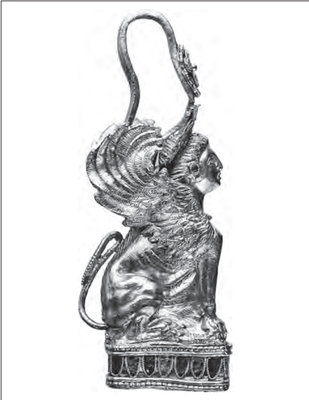
Рис. 1. Сережка із зображенням сфінкса, що сидить на постаменті (курган Старший брат з групи Трибратніх курганів (Крим))

щастя не знайшов, бо, як виявилось справдилось страшне пророцтво: Едіп убив батька і одружився на своїй матері. За уявленнями еллінів — від долі не втечеш.