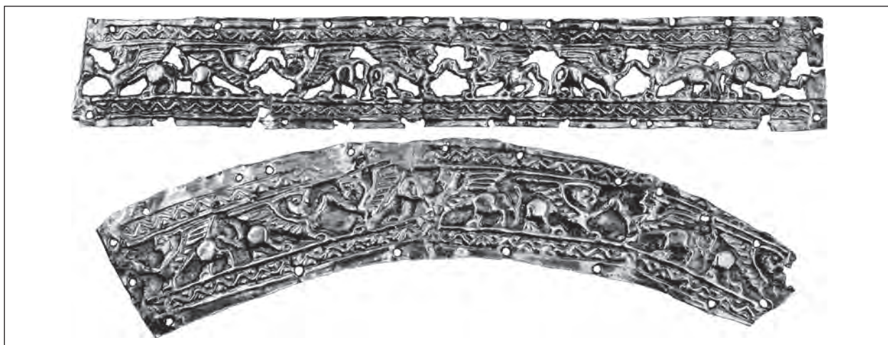
Рис. 4. Пластинки декоровані орнаментальним мотивом: сфінкс і грифон у геральдичній позиції — прикраси головних уборів (курган 22, пох. 1 поблизу с. Вільна Україна, Херсонська обл.)

з фантастичною істотою, перемога над якою символізує утвердження буття через подолання смерті.