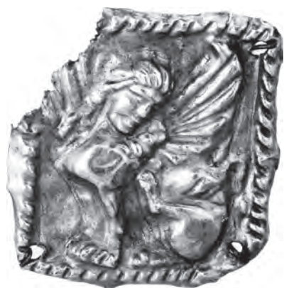
Рис. 2. Пластинка із зображенням сфінкса (Бердянський курган поблизу с. Нововасилівка, Запорізька обл.)