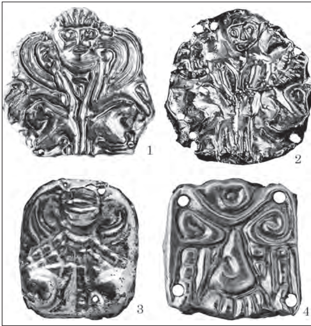
Рис. 6. Золоті пластинки-аплікації — елементи костюмних комплексів: 1 — курган 2 поблизу урочище Галушино, Черкаська обл.; 2—4 — курган 4 поблизу с. Новоселиця, Черкаська обл.

Л. В. Копейкіна також, тобто, як і А. П. Манцевич і Н. А. Онайко, підкреслила, що мотив «сфінкс з подвійним тулубом» був поширений в античному світі, а своє походження веде зі східного мистецтва (Копейкіна 1986, с. 56—57). Куль-Обські вироби — зразок трактування образу сфінкса за традиціями греко-скіфського стилю. Пластинка ажурна, вирізана за контуром зображення сфінкса з подвійним тулубом. У центрі — велика голова істоти з грубуватими рисами обличчя і зачіскою у вигляді трьох завитків. Фігури сфінксів, що сидить, передані схематично: крила, підняті вгору, загнутими кінчиками торкаються голови, невіразними рельєфними лініями показано хвости, профільна позиція ніг підкреслює особливості композиції (Онайко 1970, с. 42, рис. 9). Л. В. Копейкіна вважала, що пластинки виготовлені в боспорських майстернях. Однією з ознак виробів боспорських тореєтів була своєрідна ажурність: майстри вирізали окремі ділянки виробу, щоб яскравіше виділити контури зображення (Журавлев, Новикова, Шемаханская 2014, с. 133, кат. 33—34).