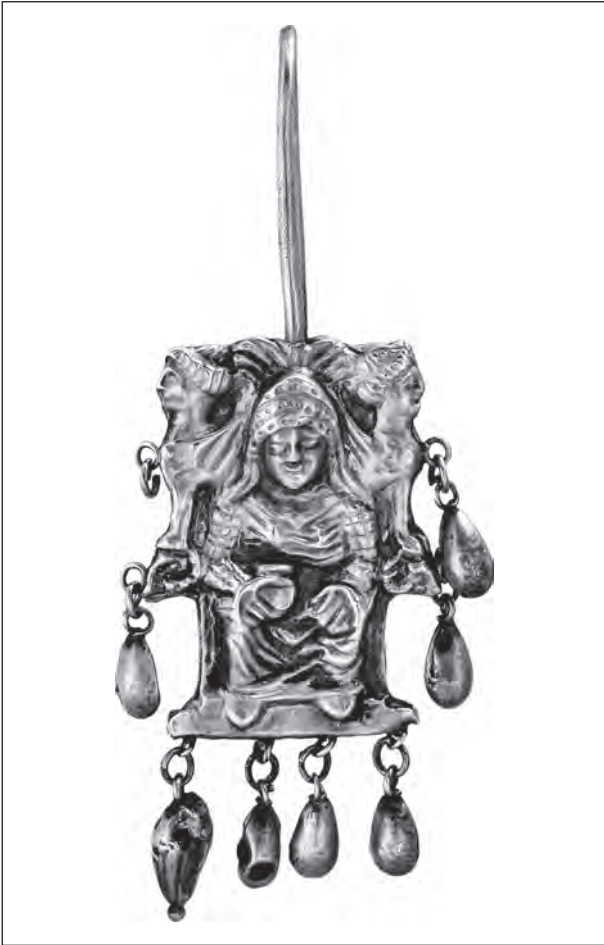
Рис. 10. Зображення богині на троні зі сфінксами обабіч (сережка з кургану 10 поблизу Велика Знам'янка, Запорізька обл.)

Криму, золоті пластинки з с. Малої Лепетихи, с. Вовчанське (рис. 5: 2). Привертає увагу зображення голови сфінкса на прикрасах із радгоспу Степовий: від скронь обабіч спускаються дві смужки (рис. 8: 1).