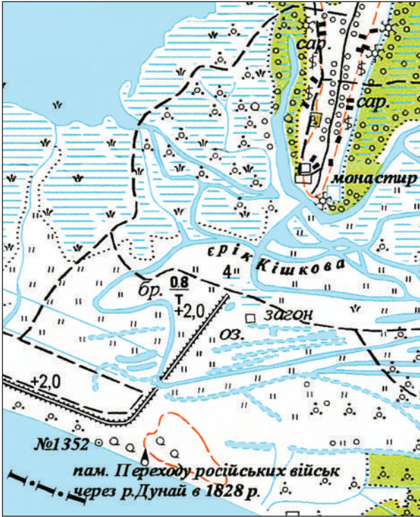
Рис. 3. Грунтова дорога от Дуная (карта конца 1940-х гг.)

надежно охраняемыми транспортными магистралями. На землях между Днестром и Дунаем передовые рубежи обороны нижнедунайской границы составляли Тира, с расположенным в этом поле римским гарнизоном, вероятно, Никоний и Нижний Бессарабский вал. Сле-