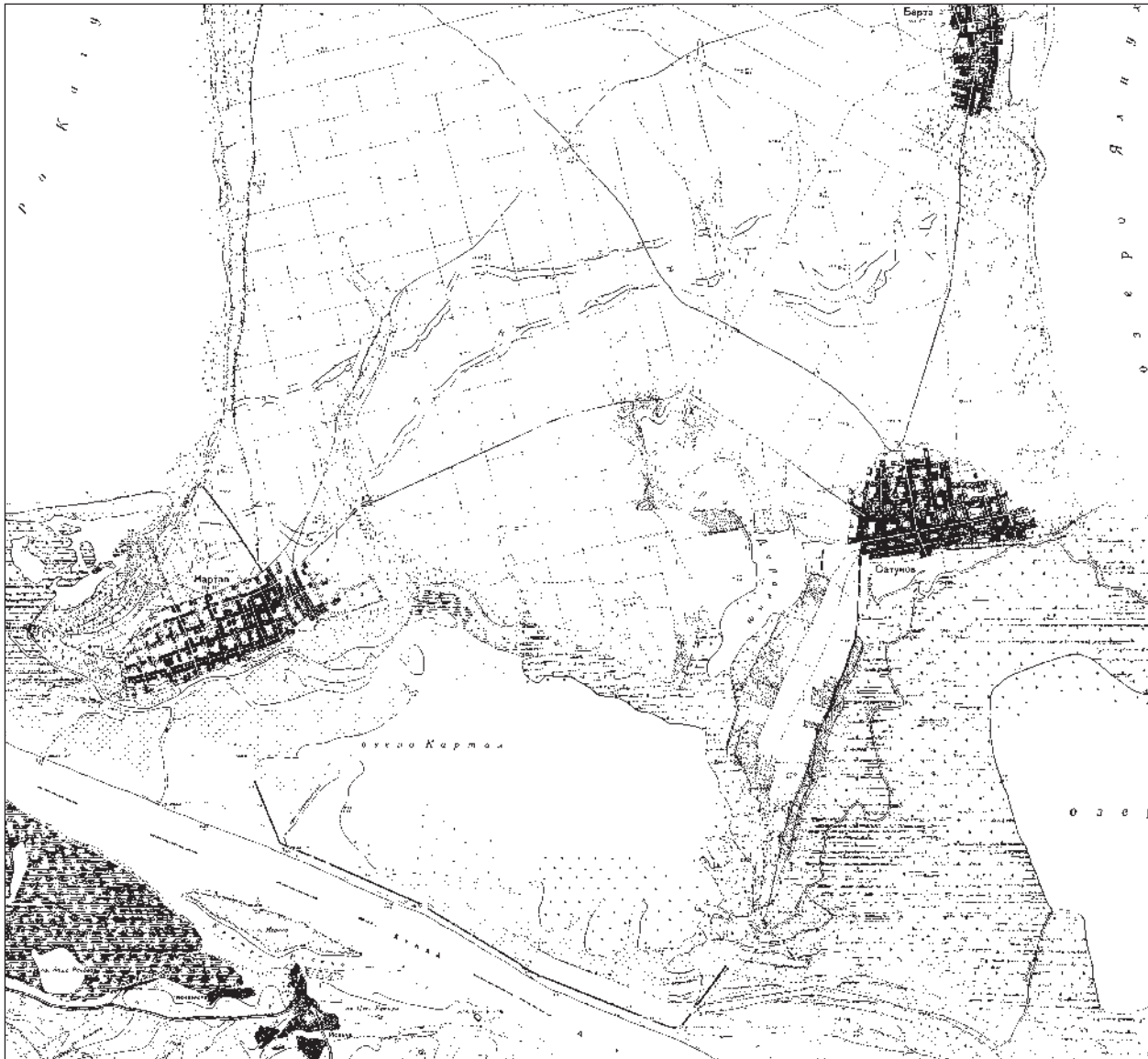
Рис. 1. Район переправи через Дунай у оз. Картал (карты 1941 г.)

Сапожников 2011, с. 217, фото 4, 5), причем, представляется необходимым отметить, что в текстовом описании объекта сам А. С. Уваров (1856, с. 183) писал не о вале, а о рве, у западного края которого он видел остатки стены.