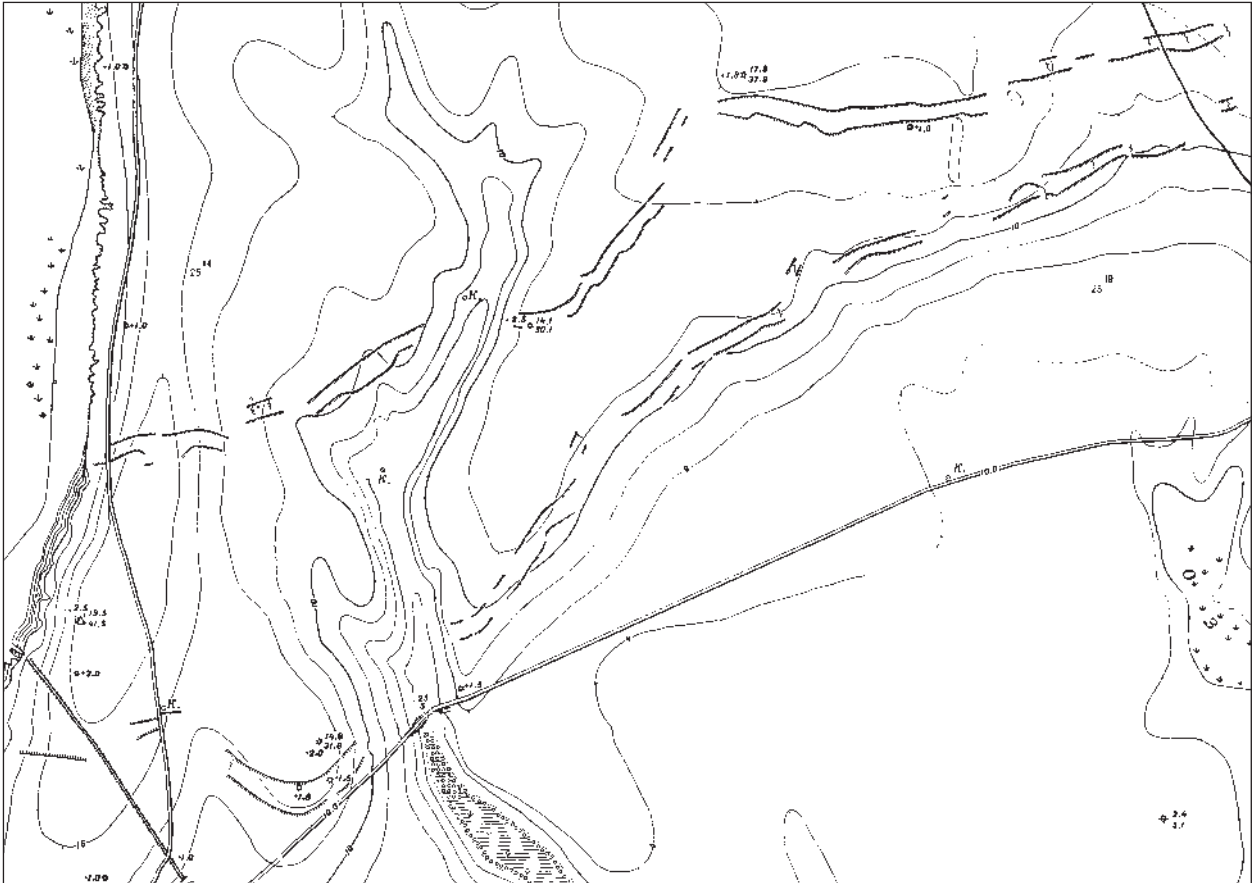
Рис. 5. Линейная полевая оборона между оз. Кагул и Ялпуг (западный участок; карта 1941 г., растительность и полевые дороги сняты)

Впрочем, нельзя исключать и вероятности строительства этой дороги опять-таки готами, однако, в связи событиями 376 г., когда имело место их массовое переселение на территорию империи. «А тервинги приняты до этого в пределы империи, все еще скитались возле берегов Дуная, так как их угнетало двойное затруднение вследствие подлого поведения командиров: они не получали провианта, и их намеренно задерживали ради позорного торга. Когда они это поняли, то стали горячо говорить, что они примут свои меры для отвращения бедствий причиняемых им предательством; и Луциан, опасаясь возможного бунта, подошел к ним с военной силой и побуждал их скорее выступить. Этим удобным моментом воспользовались гревтунги: они заметили, что солдаты заняты были в другом месте и что переплывавшие с одного берега на другой суда, которые препятствовали их переходу, остаются в бездействии, они сколотили кое-как лодки, переправились и разбили свой лагерь вдалеке от Фритигерна» (Amm. Marcell., XXXI, 5, 1—3).