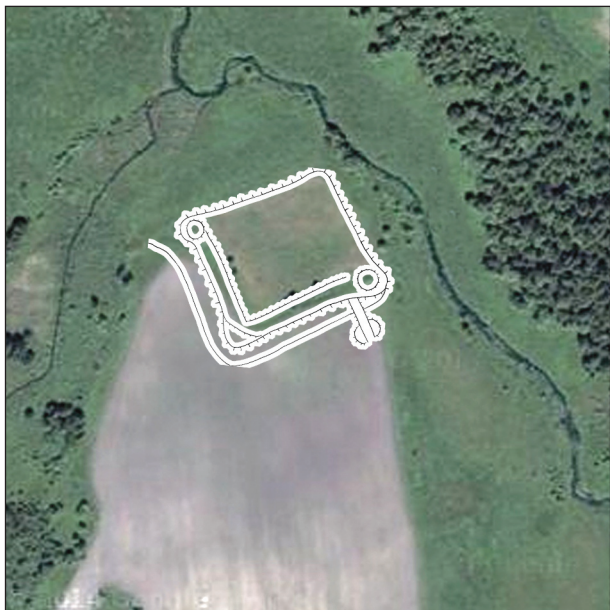
Рис. 3. Результат накладення окомірного плану пам'ятки 1989 р. на космоснімок Google Earth

С восточной и западной стороны также две стены; но без зубцов, вышиною в 1,5 сажени. С восточной стороны протекает река Здвиж, которой вода, входя в каналы, окружает весь замок» [Фундуклей, 1848, с. 40].