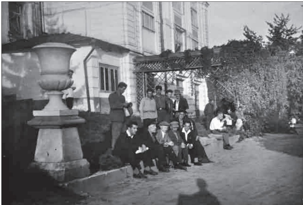
Члени «Експедиції для дослідження історії промисловості України» в 1932 році після конференції в м. Житомир [НА ІА НАН України, ф. ПМК / Полісся, спр. 3, арк. 4]