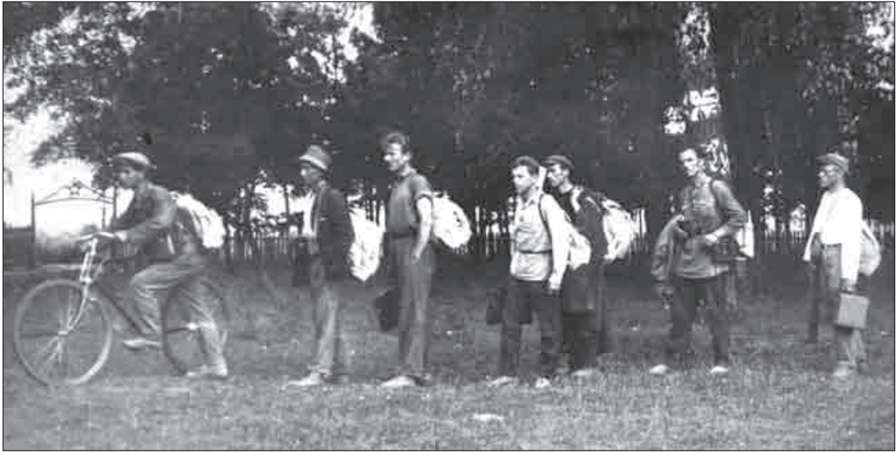
Польова група «Експедиції для дослідження історії промисловості України» в 1932 році в дорозі [НА ІА НАН України, ф. ПМК / Полісся, спр. 3, арк. 13]

розкопках території Михайлівського монастиря в Києві.