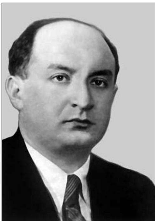
Лазар Мойсеевич СЛАВІН (1906—1971)

Славін Лазар Мойсеевич (1906—1971). У 1938—1971 рр. працював у ІА АН УРСР, 1939—1945 рр. — директор ІА НАНУ, 1938 і 1946—1950 рр. — заступник директора цього ін-ту. У 1939—1946 рр. — учений секретар Відділення суспільних наук АН УРСР. У 1944—1970 рр. керував кафедрою археології КНУ. Фахівець у галузі античної археології.