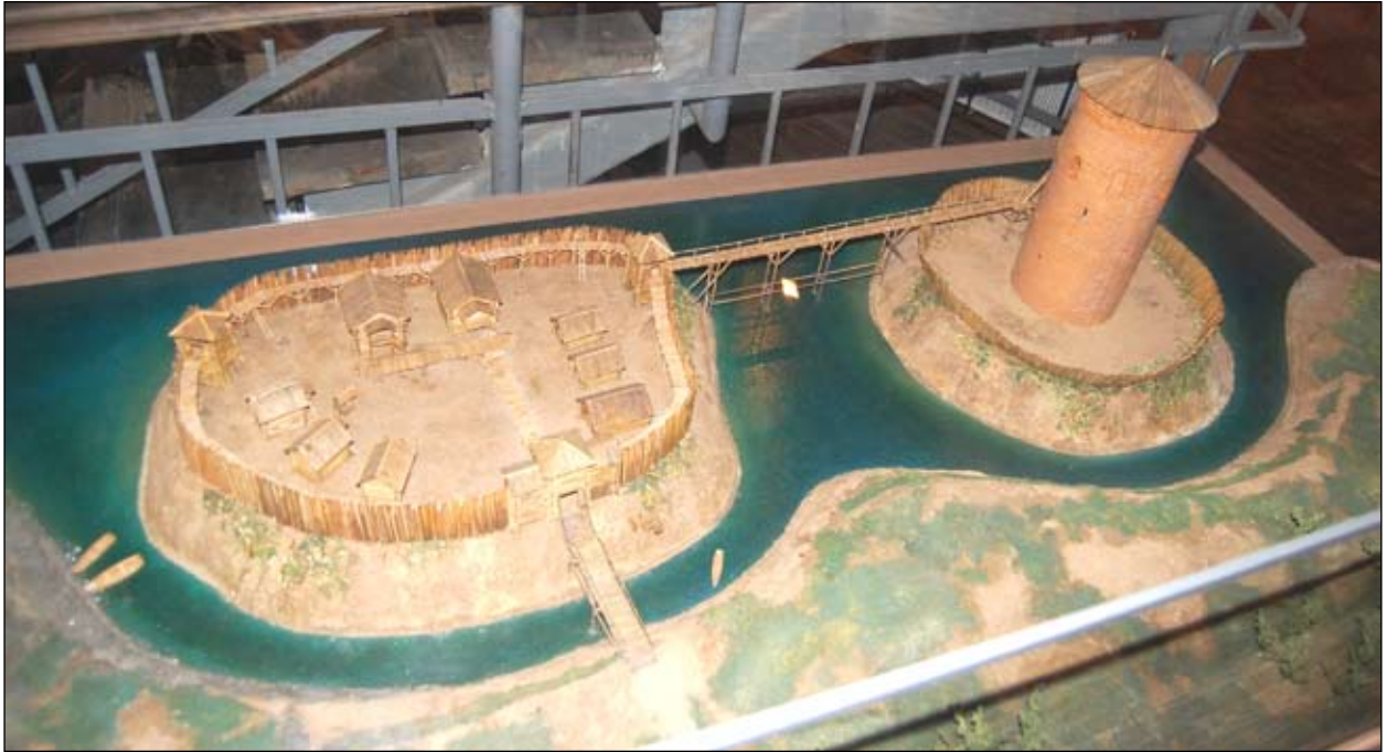
Мал. 3. Рэканструкцыя старажытнага Камянца ў музейнай экспазіцыі «Камянецкая вежа» (пав. А. Башкова і А. Іова)

бакоў ад уязной брамы, а пасярэдзіне пляцоўкі — не забудаваны двор (мал. 3).