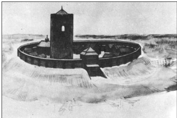
Мал. 1. Рэканструкцыя Я. Куліка і М. Ткачова