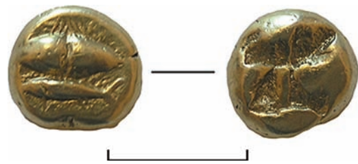
Кизикин архаического времени из Ольвии