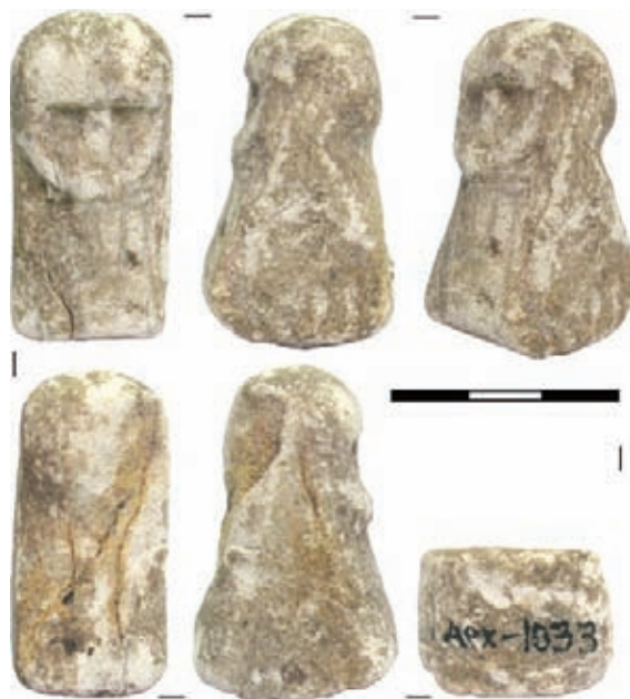
Рис. 2. Кам'яний антропоморфний король з шестовицького городища

К статті В.В. Крутилова, А.В. Буйських НАХОДКА РАННЕЙ МОНЕТЫ КИЗИКА В ОЛЬВИИ