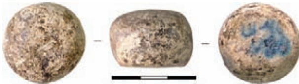
Рис. 1. Кам'яний пішак з шестовицького городища

До статті Н.В. Хамайко КАМ'ЯНІ ГРАЛЬНІ ФІГУРКИ З ШЕСТОВИЦЬКОГО ГОРОДИЩА