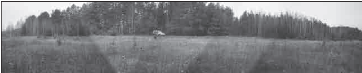
Рис. 6. Діброва 3. Поселення відкритого типу доби раннього заліза (I тис. н. е.). Фото з півдня

не на топографічних картах, проте на сьогодні воно повністю заросло травою й чагарниками і не має вільних ділянок води (рис. 1).