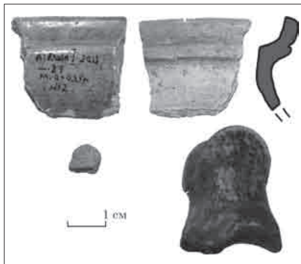
Рис. 3. Знахідки з поселення: вінце гончарної посудини, уламок стінки ліпної посудини та кістка тварини

З культурного шару поселення походять знахідки кісток тварин, деякі обвуглені та повністю кальціновані; шматки деревного вугілля, печини. Виявлено фрагмент ліпної посудини доби бронзи — раннього залізного віку,