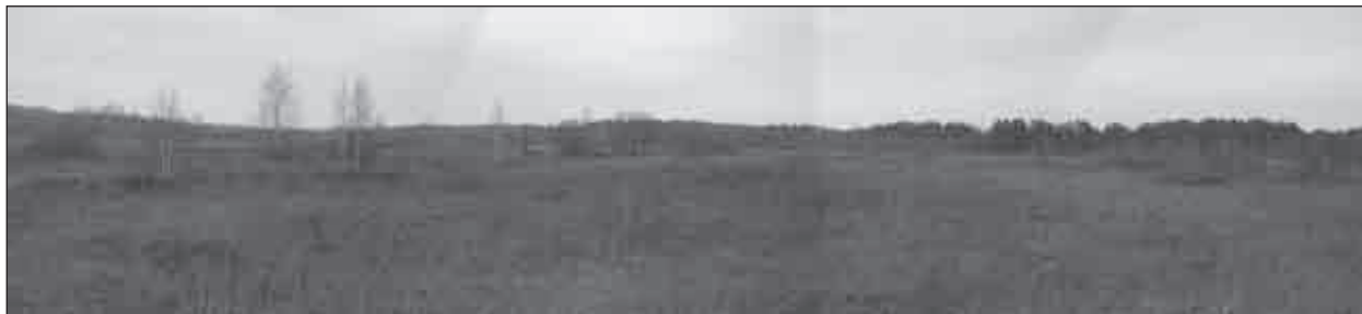
Рис. 4. Діброва 2. Поселення виробничого характеру пізнього середньовіччя. Фото з півдня