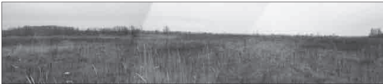
Рис. 2. Діброва I — поселення відкритого типу доби бронзи — раннього залізного віку та пізнього середньовіччя. Фото з півночі

За результатами вивчення літературних та архівних джерел дані про археологічні пам'ятки, відкриті в межах обстежуваної території, не виявлено. Віддаленість від річок, великих озер, заболоченість значної частини площі та важка доступність через чагарники та лісові насадження, вірогідно, стали основною причиною того, що переважна більшість дослідників археологічних старожитностей оминали увагою вказану територію. Археологічні розвідки І.П. Русанової пройшли південніше, по течії р. Ірша. В.К. Пясецький обстежував ліві притоки р. Ірша в районі с. Ємилівка (Русанова, 1958, с. 33—46; 1960, с. 63—69; 1973; Пясецький, 1973).