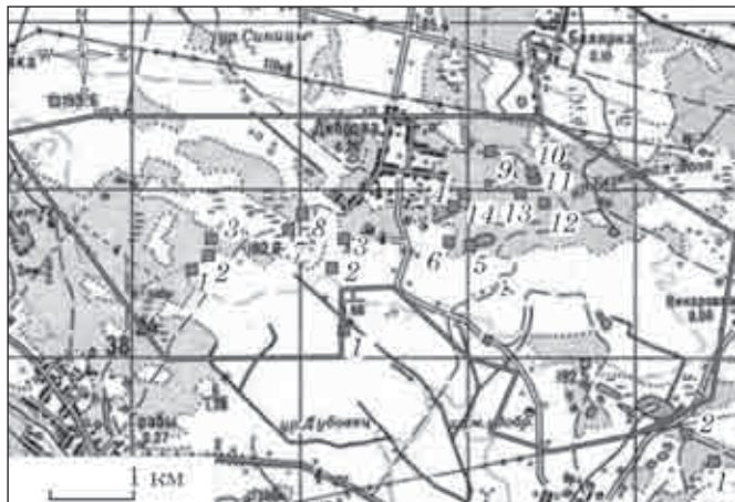
Рис. 1. Загальний план ділянки Стремигородського гірничозбагачувального комбінату та археологічних пам'яток на цій території

У межах обстежуваної зони, в південній її частині, де наявні значні ділянки горизонтальних відшарувань ґрунту, проводилось детальне візуальне обстеження з метою виявлення ознак культурного шару. На переважній частині ділянки поверхня задернована і зайнята чагарниками та лісом, тому пошуки культурного шару проводились шляхом шурфування території. Пам'ятки з наземними візуальними ознаками (кургани, городища, вали та ін.) обстежувались шляхом звичайного огляду місцевості.