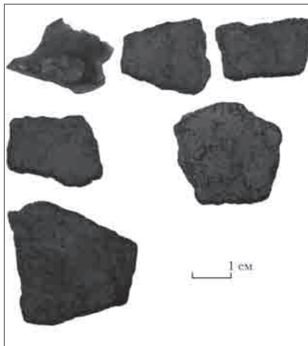
Рис. 7. Діброва 3. Фрагменти стінок ліпних посудин доби раннього заліза (I тис. н. е.)

Курганний могильник із двох насипів розташований за 0,8 км на південний захід від південно-західного краю с. Діброва. З північного краю могильника проходить ґрунтова дорога