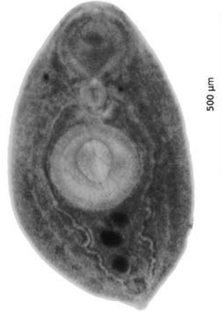
Рис. 1. Pseudoleucochloridium soricis (метацеркария).

С целью выявления личинок паразитических червей в июле 2013 г. на территории Шацкого национального природного парка Волынской обл. компрессорным методом были исследованы две группы беспозвоночных: пресноводные гаммарусы ( Gammarus sp.) и наземные моллюски двух видов — Bradybaena fruticum и Succinea sp. Всего собрано 176 экз. гаммарусов: 61 экз. на озере Свитязь, 29 экз. на озере Перемут и 86 экз. на озере Песочное. Все наземные моллюски (230 экз.) были собраны на острове озера Свитязь: 93 экз. B. fruticum и 137 экз. Succinea sp. Обнаруженных личинок фиксировали в 70° спирте, окрашивали железным ацетокармином, после дифференцирования обезвоживали в спиртах восходящей концентрации, просветляли в гвоздичном масле и заключали в канадский бальзам. Вооружение сколексов цестод изучали на постоянных препаратах в жидкости Фора-Берлизе. Все промеры приведены в микрометрах, если не указано иначе.