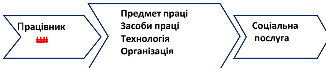
Рис. 4. Працівник та штучний інтелект в процесі соціальної роботи

Для більш повної характеристики місця і ролі людини та штучного інтелекту на ринку праці доцільно розглянути ще одну сферу людської діяльності – соціальну роботу . Соціальна праця передбачає роботу з людьми. Її метою є допомога людям у подоланні особистих та соціальних проблем. Соціальний працівник є професійним консультантом та комунікатором. Соціальна робота в першу чергу вимагає високого рівня людяності, розвинутої інтуїції, емпатії. Ці якості властиві людям, але не штучному інтелекту (рис. 4).