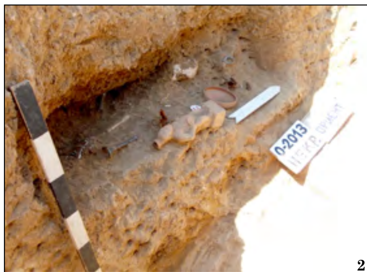
Рис. 1. Вид погребения 2013/14 с востока (1) и юго-востока (2)