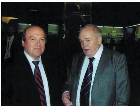
З академіком Є.П. Веліховим

дії НАН України, спрямованих на збереження наукового, кадрового потенціалу академічної науки, глибоку реорганізацію діяльності Академії відповідно до завдань того часу, становлення і розвиток життєво необхідних незалежній Україні наукових напрямів, вдосконалення організації та координації фундаментальних і прикладних досліджень, на підготовку наукових кадрів. У непростих умовах становлення державності, протидіючи необґрунтованим бажанням деяких політиків позбутися нібито «зайвого для України надлишкового наукового потенціалу», академік А.П. Шпак, разом з іншими провідними вченими, доклав чимало зусиль для відстоювання пріоритетів академічної науки, досягнення порозуміння й розвитку співробітництва Академії з органами державної влади, політикумом, діловими колами.