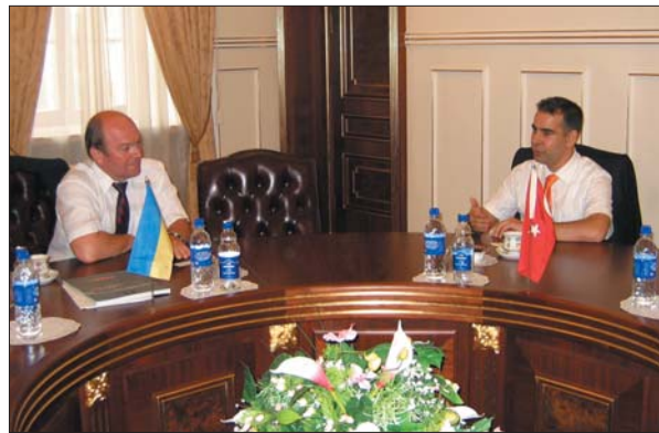
Академік НАН України А.П. Шпак приймає делегацію Ради з питань науково-технічних досліджень Туреччини (TUBITAK), червень 2006 р.

відповідальність, ініціативність, комплексний підхід до вирішення різних проблем, вміння підбирати й виховувати кадри, виваженість і вимогливість до себе та свого оточення. Якщо в науці його вчителем був В.В. Немошкаленко, то в організації науки — Б.Є. Патон, особистий приклад і настанови якого сприяли формуванню Анатолія Петровича як керівника вищої ланки.