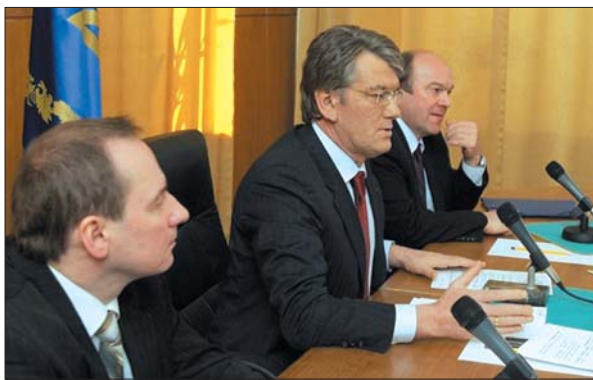
Нарада під головуванням Президента України В.А. Ющенка з питань створення в м. Суми науково-виробничої бази спеціальної металургії, 23 березня 2007 р.