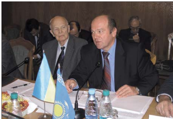
Під час засідання Ради Міжнародної асоціації академій наук. Київ, 23 листопада 2005 р.