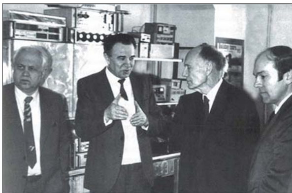
В Інституті електронної фізики НАН України (зліва направо): В.Г. Бар'яhtar, О.Б. Шпеник, Б.Є. Патон, А.П. Шпак. 1993 р.