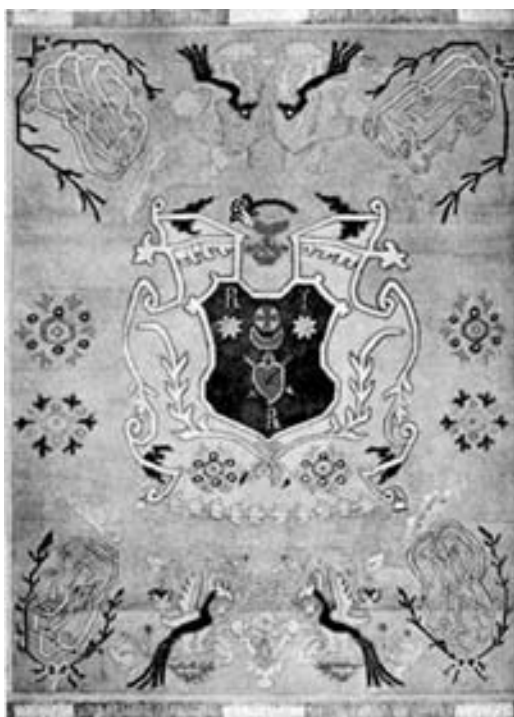
Килим з гербом П. Полуботка. Акварель В. Г. Кричевського. 1913 р.