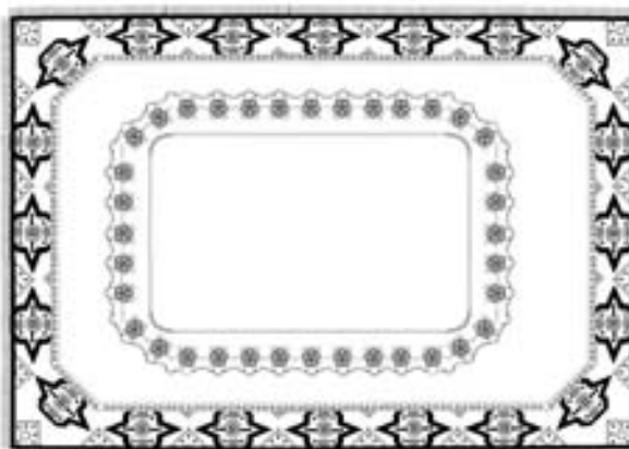
Спроба реконструкції килима з портрета В. А. Дуніна-Борковського.

Розвиток килимарства в Україні зазначеного періоду був зумовлений широким