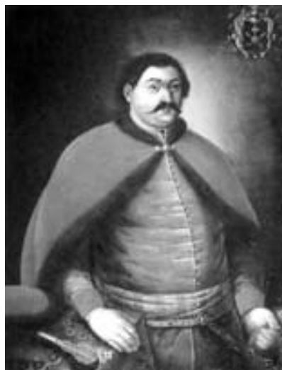
Портрет П. Полуботка. Копія ХІХ ст.

використанням килимових виробів у побуті людей різних станів. Більше відомо про побутування їх у житті козацької старшини, вони стали своєрідним феноменом елітарної культури українського суспільства того часу. Килими активно і широко використовувались у побуті та різних обрядах. Ними покривали столи, лави, ліжка. Рідше килими клали на підлогу – під час урочистостей і обрядових дійств. Навіть на початку ХХ ст. у поліських селах брали шлюб, стоячи на килимі. Інший килим лежав на ослоні, на якому сиділи батьки молодих. Під час поховального обряду тіло покійника вкривали килимом, який у цьому випадку мав символічне значення. Він поєднував світ живих і потойбічний світ мертвих [9, с.143 – 144]. Килими висіли на стінах осель, ними покривали засоби пересування – вози і сани. Саме функціональне призначення впливало на їхню форму, розміри, матеріали і техніки виконання, а подекуди і на елементи декоративного оздоблення. Наприклад, для ослонів робили вузькі і довгі килими переважно з геометричними візерунками. Для столів виробляли килими, формат яких наближався до квадрата і які мали більшу м'якість. На килимах для поховання зображали надгробки, урни у лаврових вінках, вміщували тексти із Святого письма [5, с.17].