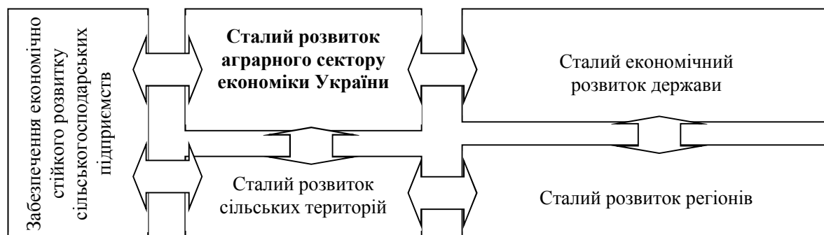
Рис. 3. Вплив аграрного сектору економіки України на формування засад сталого розвитку (розроблено автором)

У зв'язку з тим, що агропромисловий комплекс формує 14% ВВП України [8], забезпечення сталого розвитку аграрного сектору економіки – базова передумова формування засад сталого економічного розвитку держави (рис. 3).