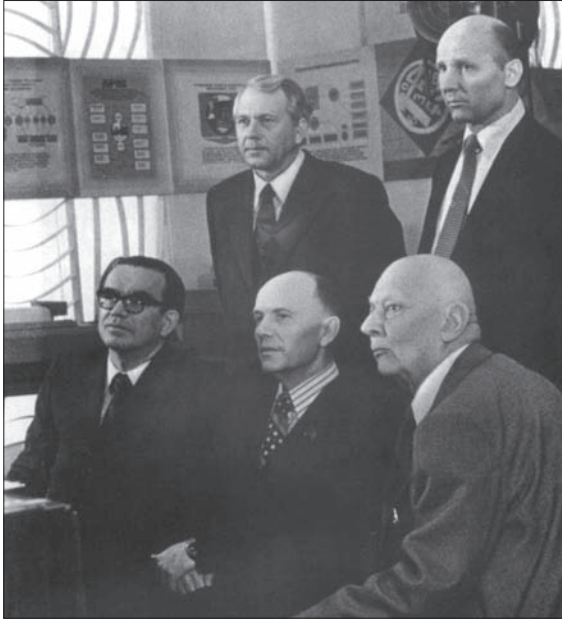
В Інституті кібернетики АН УРСР. А.П. Александров, Б.Є. Патон, В.П. Глушков (1978 р.)

У 1963 році Б.Є. Патон обирається членом Президії АН СРСР. Перебування на цій посаді дозволило йому ознайомитися з роботою інститутів АН СРСР, вивчити досвід діяльності Президії АН СРСР та її відділів. Добрі ділові стосунки склалися у нього з президентами АН СРСР М.В. Келдишем, А.П. Александровим, головою Сибірського відділення АН СРСР М.А. Лаврентьевим і багатьма іншими вченими. Це дозволило Б.Є. Патону організувати співробітництво вчених України та Москви, Ленінграда, Новосибірська, інших регіонів РРФСР і союзних республік і сприяло розвитку науки в Україні. З їх допомогою вирішувалися важливі питання розвитку окремих напрямів, створення міжгалузевих науково-технічних комплексів, міжнародного науково-технічного співробітництва. Тісна співпраця між АН УРСР, АН СРСР, Державним комітетом з науки і техніки СРСР, академіями наук союзних республік сприяла розвитку в Україні багатьох нових наукових напрямів, створенню нових інститутів, інженерних центрів, зміцненню міжнародного авторитету Академії наук України.