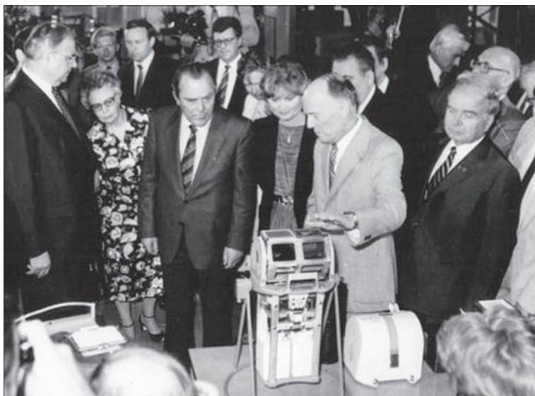
Канцлер ФРН Гельмут Коль в ІЕЗ біля експозиції космічних досліджень (4 червня 1983 р.)

вальної техніки». Постанова передбачала розвиток фундаментальних досліджень, розроблення обладнання, матеріалів, технологій, створення нових НДІ і заводських лабораторій, будівництво спеціалізованих заводів з виробництва зварювального обладнання, матеріалів, зварних конструкцій [15].