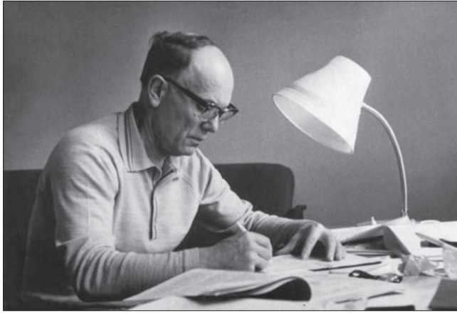
Час працювати над рукописами. 1975 р.

витим учнем і гідним послідовником свого батька. Одним із основних принципів, закладених Є.О. Патонем при створенні інституту і розвинених Б.Є. Патонем, є проведення цілеспрямованих фундаментальних досліджень і тісний зв'язок із виробництвом. Цей принцип наполегливо втілюється в життя протягом всього існування ІЕЗ. Наукові відділи, конструкторський відділ, експериментальні майстерні, дослідне конструкторсько-технологічне бюро, інженерні центри, експериментальні виробництва, дослідні заводи, які створювалися впродовж усієї історії інституту, — це невід'ємні ланки системи організації досліджень і впровадження їх результатів у виробництво.