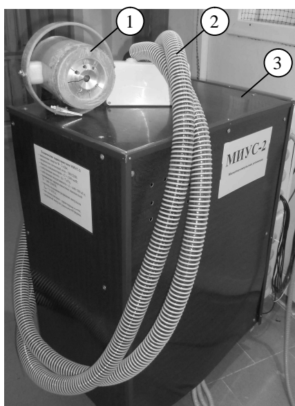
Рис. 1. Экспериментальный комплекс бесконтактной магнитно-импульсной рихтовки: 1 – инструмент магнитно-импульсного воздействия; 2 – кабельный подвод; 3 – магнитно-импульсная установка МИУС-2

Для проведения эксперимента были взяты образцы панели кузова автомобиля фирмы "Субару" толщиной \sim 0,8 мм.