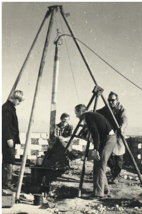
Рабочий момент на скважине «Донузлав», 1982 г.