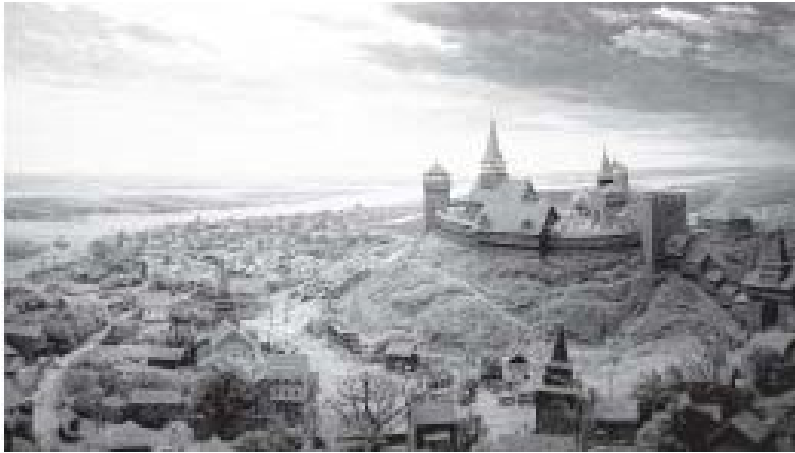
Діорама-реконструкція Черкаського замку у Черкаському обласному краєзнавчому музеї. Худ. А.В. Казанський (1985).

і особливо козачини Черкаській замок [5]. В 1532 році цей замок, як і саме місце, на довгий час було обложено татарами з великою гарматною стрільбою [6], але без усякого успіху, і потім навкруги цього замка багато було пролито крові на протязі української історії аж до часів Коліївщини [7]. Ще в половині перейшлого віку, як це видно з архівних матерьялів, це місце було відомо серед населення Черкас під назвою «Замковище» [8]. – Зараз це місце уявляє з себе звичайний цвінтарь, улюбленій місцевим населенням завдяки тому чудовому краєвіду, якій відкривається з цього цвінтаря на Дніпро і околиці, і тому завжди відвідуваємий [9].