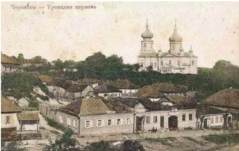
Троїцька церква. Фото початку ХХ ст.

гідні відомо, що праворуч і ліворуч від «Замковища» знаходилися 2 городища, що датуються ХІІ–ХVІІІ ст. (див. рис. 2).