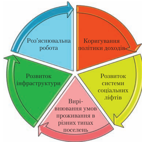
Основні складові політики утвердження соціальної справедливості

3. Розвиток середнього класу і політичних партій середнього класу. Законодавче закріплення демократії в усіх сферах суспільного життя . Саме цей фактор консолідації здатний