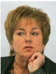
ЛІБАНОВА Елла Марленівна — академік НАН України, академік- секретар Відділення економіки НАН України, директор Інсти- туту демографії та соціальних досліджень ім. М.В. Птухи НАН України