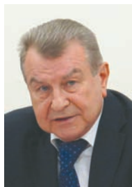
БОГУЦЬКИЙ Юрій Петрович — академік НАМ України, радник Президента України, віце-президент Національної академії мистецтв України