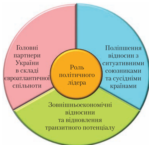
Пріоритети державної політики України у сфері міжнародних відносин

Демократична ідентичність українського суспільства має проявлятися спільним вибором цілей, моделей та шляхів реформування, практикою відкритого публічного діалогу, ініціативою «знизу», активним функціонуванням громадянського суспільства, зокрема волонтерських рухів, інтеграцією активних громадян у соціальні комунікації, ефективною дією механізмів спільної відповідальності влади і громадян, соціальною спрямованістю суспільно-політичного укладу, закріпленою Конституцією та усією правовою системою України.