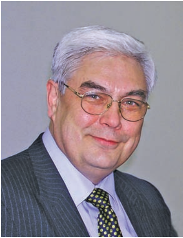
ПИРОЖКОВ Сергій Іванович — академік НАН України, віце-президент НАН України, голова Секції суспільних і гуманітарних наук НАН України