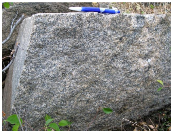
Рис. 1. б Теж саме у вертикальному субмеридіональному зрізі – площині сланцюватості. Видно субвертикальну лінійність за біотитом. Експозиція західна.

За даними [5, 7 та ін.], Мокромосковський масив сформовано декількома різновидами гранітів: найбільш розповсюджені темно-сірі дрібнозернисті, менше – біотит- та мусковітвмісні пегматоїдні. Граніти містять декілька генерацій пороудоутворювальних мінералів та ядер і оболонок доростання в акцесорних мінералах. Температура утворення провідних різновидів гранітів – 540-670^\circ\text{C} ; вік граніту за цирконом – 2827 \pm 7,2 млн. років, за монацитом — 2700 \pm 8 млн. років [5].