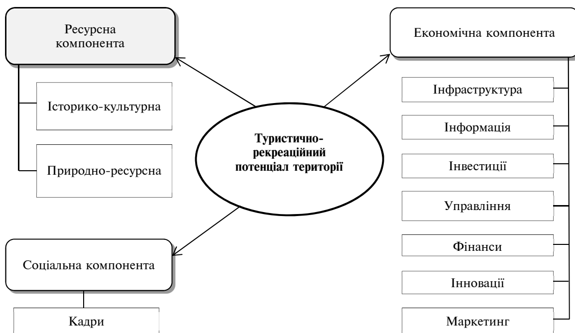
Рис. 1. Складові компоненти туристично-рекреаційного потенціалу території (узагальнено автором)

Підсумовуючи попередні дослідження вчених, наведемо власну, узагальнену схему, яка включає три основні складові компоненти туристично-рекреаційного потенціалу території (рис.1): ресурсна, соціальна та економічна.