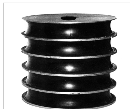
Рисунок 2 – Виброизолирующая опора дробилки КИД-2200

4. Разработанные конструкции виброизоляторов могут успешно применяться для виброизоляции машин различного технологического назначения во многих отраслях промышленности.