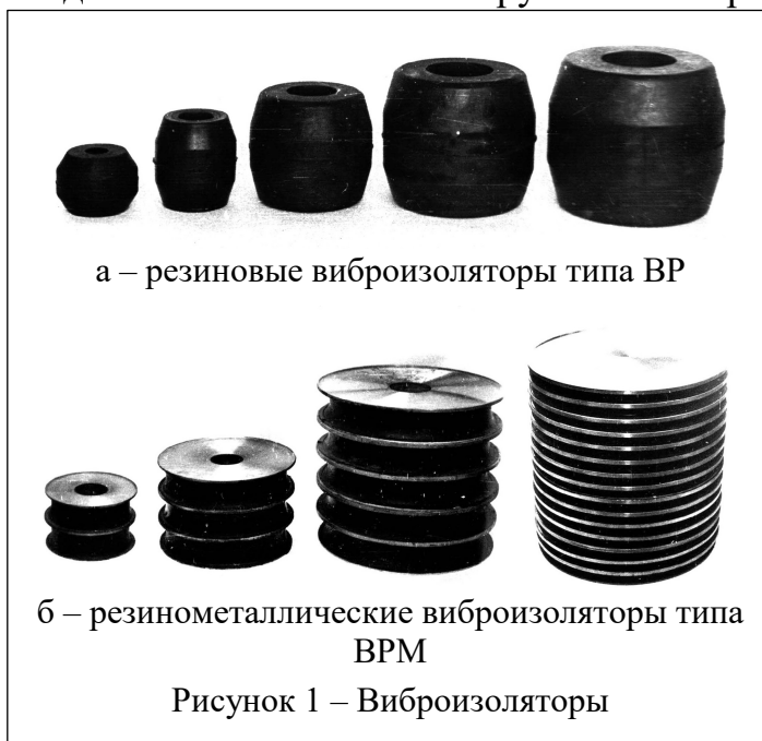
Рисунок 1 – Виброизоляторы

Резинометаллические виброизоляторы типа ВРМ (рис. 1, б) представляют собой сплошные резиновые цилиндры в виде шайб с привулканизованными по торцам металлическими пластинами или, как вариант, вставленными в металлические стаканы. Виброизоляторы имеют диаметр 200, 300, 400, 430, 600 мм с толщиной резинового слоя 5, 10, 20, 40, 70, 120 мм. Конструкция металлической арматуры виброизоляторов позволяет составлять их в стопки, что даёт возможность перекрывать практически любой диапазон жесткостей нагрузок. Все перечисленные виброизоляторы прошли проверку на различных типах технологических машин. разработаны, изготовлены и прошли промышленные испытания параметрические ряды резиновых и резино-металлических элементов, обеспечивающие собственные частоты виброизолированных объектов в диапазоне 0,5-2,8 Гц при массе объектов от 50 кг до 200 т. Новизна разработанных конструкций виброизоляторов заключается в выборе соответствующей формы и