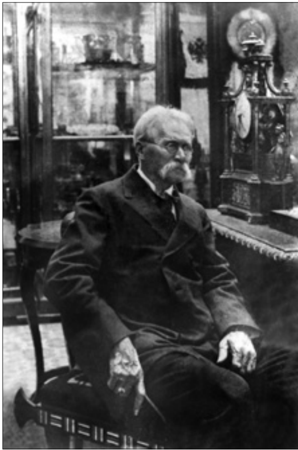
Д.І. Яворницький у Дніпропетровському історичному музеї (фото кінця 20-х років)

як прозові твори, навпаки, — відзначаються «документалізмом» характерів героїв і побуту.