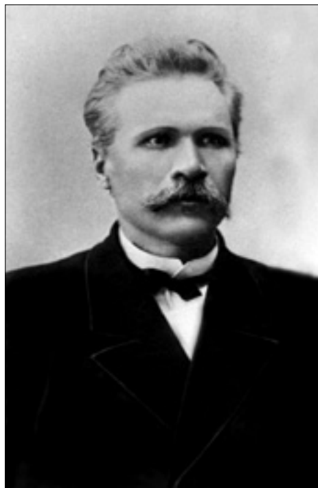
Д.І. Яворницький (фото 1900-х років)

Великий вплив на формування поетичної природи Д.І. Яворницького мала твор-