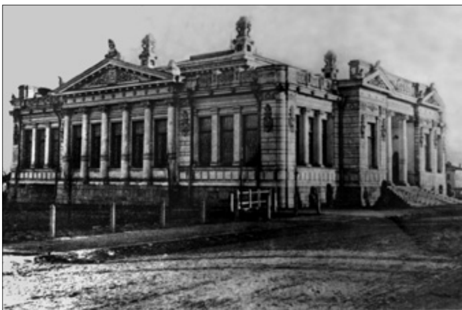
Музей ім. О. Поля в Катеринославі (1910 р.)