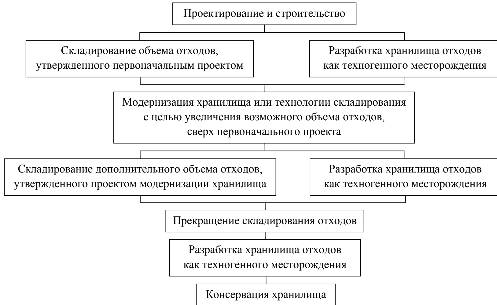
Рисунок 5 – Перспективный алгоритм эксплуатации хранилища отходов