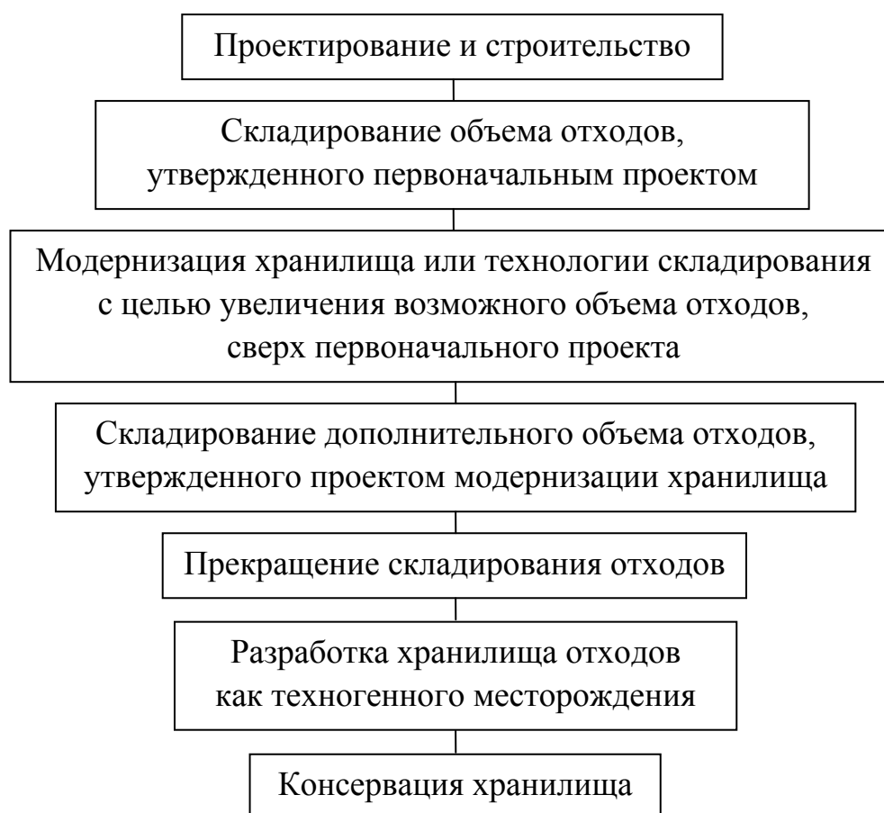
Рисунок 3 – Алгоритм эксплуатации хранилища отходов в начале XXI века

Валявкинское хвостохранилище по его составу и возможности отработки как техногенного месторождения осуществляется по алгоритму, приведенному рис. 3.