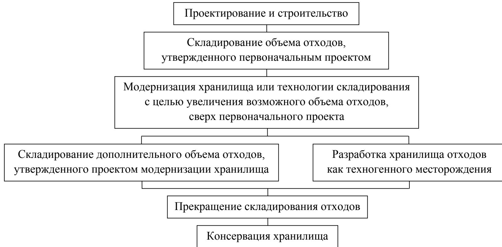
Рисунок 4 – Современный алгоритм эксплуатации хранилища отходов