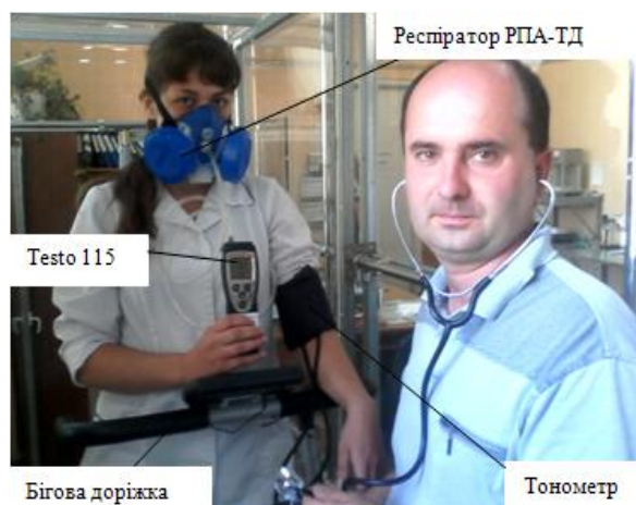
Рисунок 1 - Загальний вигляд експериментального обладнання

Кожний випробувач виконував 3 проби у респіраторі при заданій інтенсивності роботи. Дослідження проводили на респіраторі РПА - півмаска без примусової подачі повітря з двома протиаерозольними фільтрами високої ефективності, які закріплюються з боку еластичними ремнями оголів'я (рис. 1). Повітря, яке видихалось через трубку, подавалось у спеціальну камеру, де встановлювалися спеціальні пробки, з різними отворами. За допомогою яких, забезпечувався різний опір диханню у діапазоні від 10 до 100 Па. При виконанні всіх випробувань рівень опору фільтрів при вдиханні становив приблизно 25 Па при постійній швидкості потоку 95 л / хв.