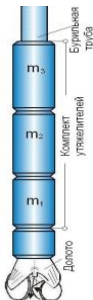
Рис. 1. Схема компоновки утяжелителей

Примеры расчета комплектов утяжелителей для шарошечного бурения долотами диаметром 151 мм показаны на рис. 2. В результате анализа графиков выделили одну из закономерностей в виде зависимости оптимального количества подвижных масс n от суммарной их массы M . Причем, при увеличении M максимальное значение K_v достигается при большем значении n .