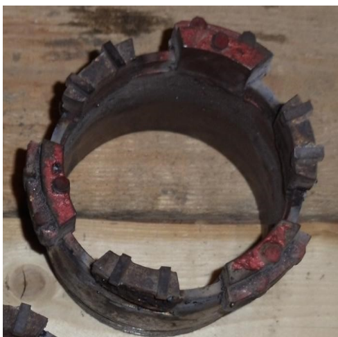
Рис. 3. Фото твердосплавной секторной ступенчатой коронки

1. Изменить конструкцию коронки, уменьшив количество секторов с расширителями до трех, тем самым снизить площадь контакта секторов на уступе забоя при бурении и площадь контакта корпуса со стенками скважины при подъеме коронки (рис. 3).