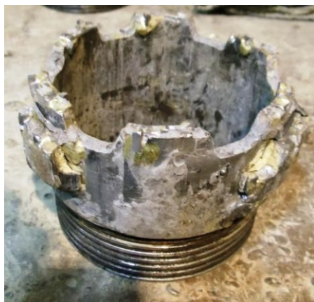
Рис. 1. Коронка типа SM-5 с дополнительными приварными секторами

В течение 2012–2013 гг. в рамках договорных отношений НИГП АК «АЛРОСА» и ЗАО ГПГ «ЭЗТАБ» многие из перечисленных направлений и разработок успешно осуществлены, выполнены соответствующие испытания на объектах заказчика, инструмент и технологии внедрены в производство буровых работ, получен существенный экономический эффект.