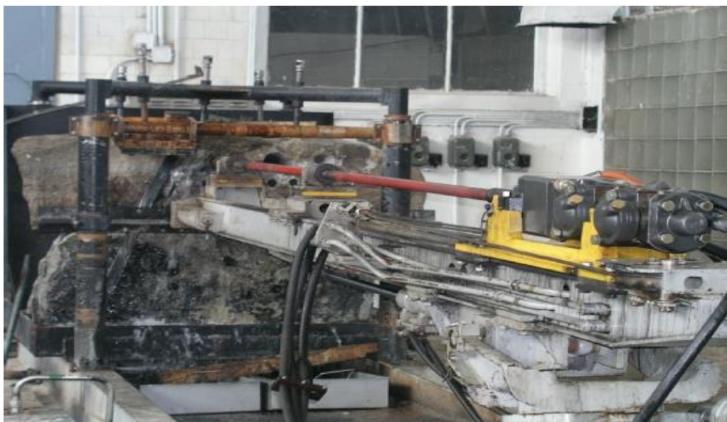
Рис. 1 Опытный образец БУР1515 на испытательном стенде. (Бурение шпуров \varnothing 43 мм и скважин \rightarrow 105 мм в гранитном монолите)

Опытная партия буроловок состояла из четырех образцов, изготовленных Госпредприятием Харьковской машиностроительный завод «ФЭД». Все образцы согласно требованиям прошли приемо-сдаточные испытания, доводку и приняты УТК завода. Настоящий отчет отражает результаты испытаний одного из равноценных образцов. Разработчики РКД – творческий коллектив «Гидробур».