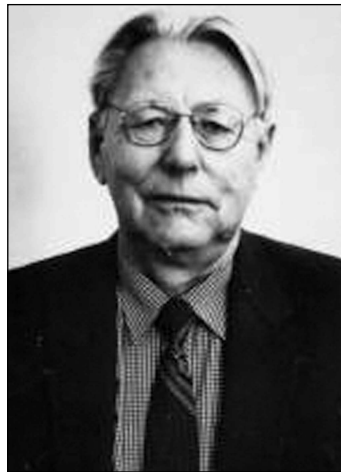
Г.Є. ПУХОВ (100 років від дня народження)

Президією НАН України засновано премію імені М.С. Грушевського (1991), його ім'я присвоєно Інституту української археографії та джерелознавства НАН України. У Києві, Львові та інших містах йому встановлено пам'ятники. Ім'я М.С. Грушевського носять вулиці, проспекти та площі в Україні.