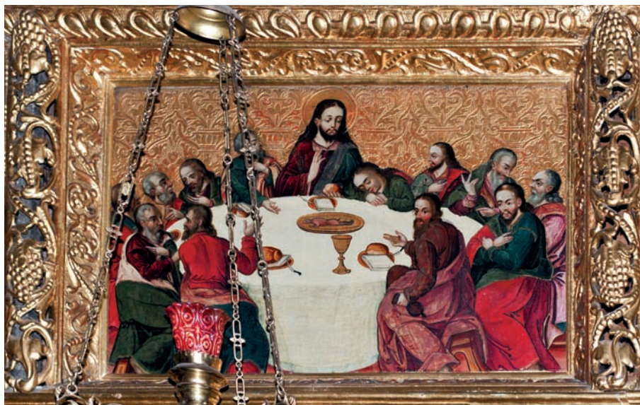
Федір Сенькович «Тайна вечеря», сер. XVII ст. Іконостас церкви Параскеви П'ятниці, м. Львів

стрів, які вони часто використовували як графічні взірці композицій.