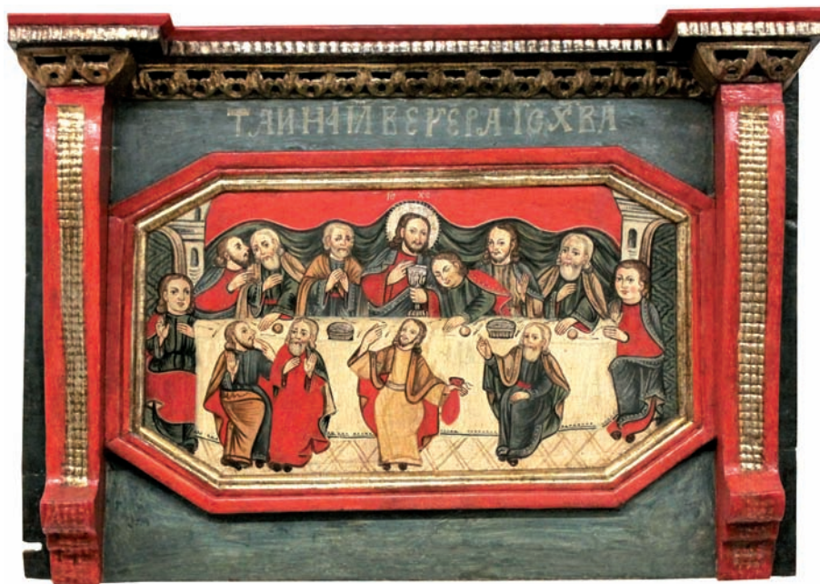
«Тайна вечеря», XVII ст., с. Соліна, Музей народної архітектури, Сянок, Польща

Унікальною особливістю зовнішності Юди Іскаріота в українській мистецькій традиції є зображення його візуально схожим на Ісуса. У такому контексті його образ сприймається своєрідним дзеркалом, протилежністю образу Христа. Юда та Ісус поєднані символічним зв'язком.