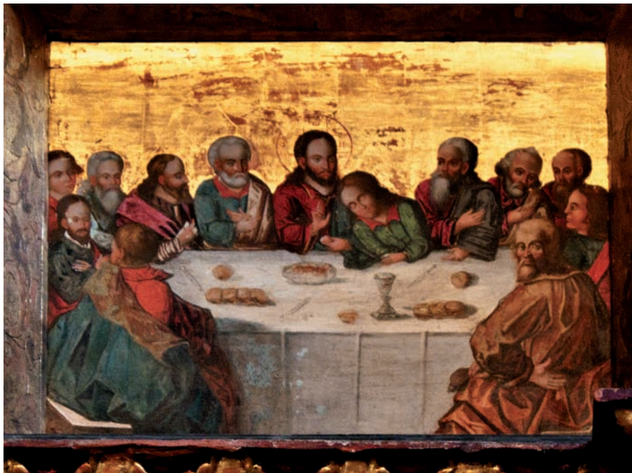
«Тайна вечеря». 1650 р. Іконостас церкви Святого Духа, м. Рогатин

майбутнього поширення ідеї християнства. Це питання ставиться як у фаховій науковій, філософській літературі, так і в художніх творах і на сьогодні залишається відкритим.