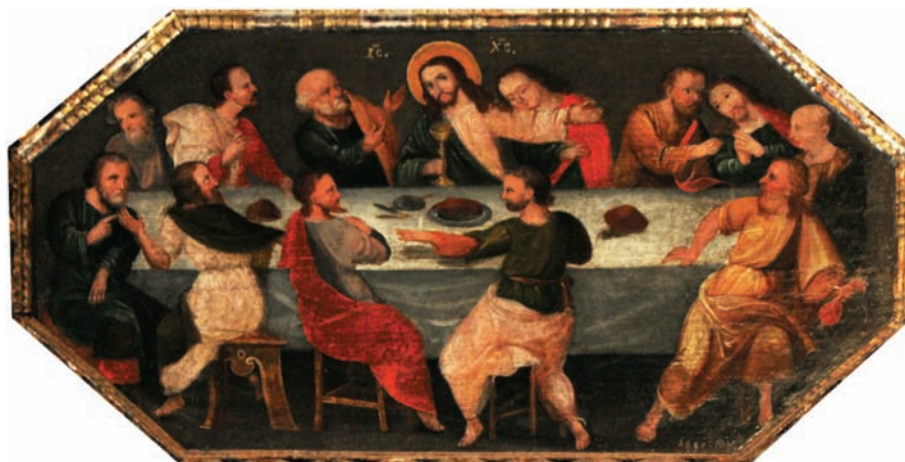
«Тайна вечеря». 1697 р. Тисовець. Історичний музей, Сянок, Польща

образ Юди Іскаріота. Виявлення особливостей іконографії, специфіки зображення Юди та символіки його образу в українському малярстві XV—XVIII ст. і було основною метою обговорюваного монографічного дослідження.