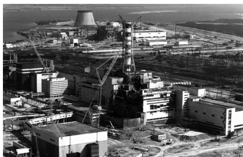
Общий вид ЧАЭС

Землетрясение и цунами, ставшие причиной аварии, унесли более 18000 жизней. После землетрясения, цунами и отказа системы охлаждения на АЭС «Фукусима-1» 11 марта 2011 года впервые в истории страны было объявлено чрезвычайное положение из-за угрозы радиоактивного заражения. 140000 жителей в