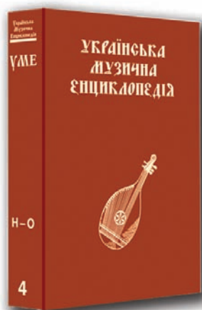
Обкладинка 4-го тому «Української музичної енциклопедії»

Розроблено також нові методичні підходи до оцінювання конкурентоспроможності промислового сектора вітчизняної економіки, на підставі якого проведено порівняльний аналіз структурних переваг промисловості України та країн — членів ЄС.