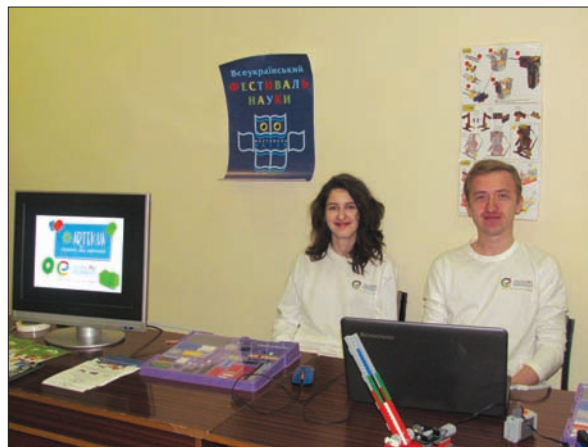
Вихованці Малої академії наук України представляють свої досягнення на відкритті XI Всеукраїнського фестивалю науки в Києві. 18 травня 2017 р.

Окремим пріоритетом діяльності Академії вже понад три роки залишається виконання досліджень, спрямованих на зміцнення безпеки й оборони держави. Більшість робіт за цим напрямом виконувалися у межах цільової науково-технічної програми НАН України «Дослідження і розробки з проблем підвищення обороноздатності і безпеки держави».